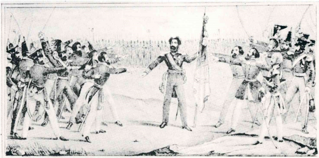
D. Pedro e o seu desembarque na Praia de Pampelido