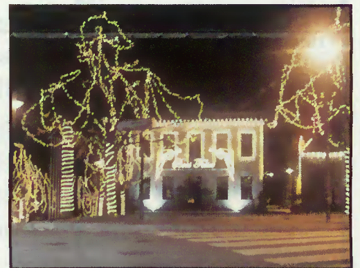
Iluminação do edifício da Câmara

Dando continuidade à experiência dos anos anteriores, na quadra natalícia, a Câmara Municipal associou-se aos terrabourenses e visitantes, tendo preparado a iluminação nas ruas com motivos diferentes dos anos anteriores, aproveitando as árvores para as respectivas ornamentações.