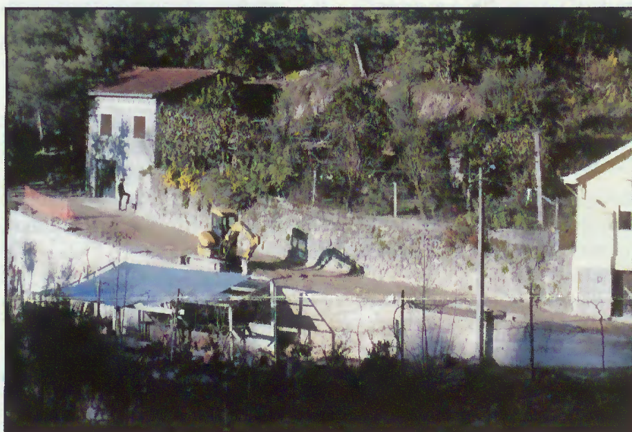
Construção de muros e alargamento de via

e o diálogo com os proprietários, tem sido possível melhorar as acessibilidades através do alargamento do caminho com a construção de alguns muros de suporte.