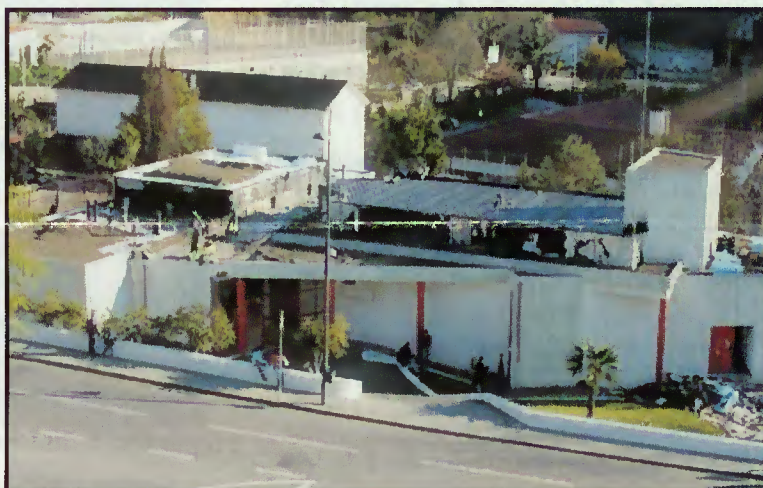
Instalações do Centro Cultural

várias actividades, estando previsto ainda a construção de uma sala com formato de auditório.