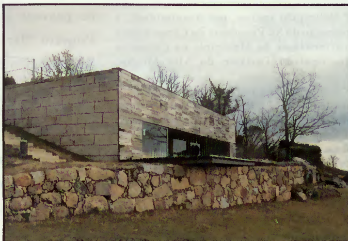
Aspecto frontal do edifício

os proprietários, quer para a freguesia, sendo já uma referência nos mais conceituados órgãos de informação.