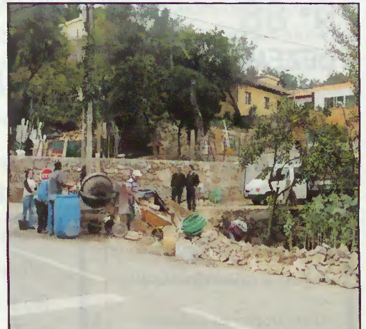
Execução das obras

A segurança e as condições do trânsito foram substancialmente melhoradas com aumento do espaço de estacionamento. O projecto resulta do empenho e colaboração entre a Câmara, a Junta e proprietária.