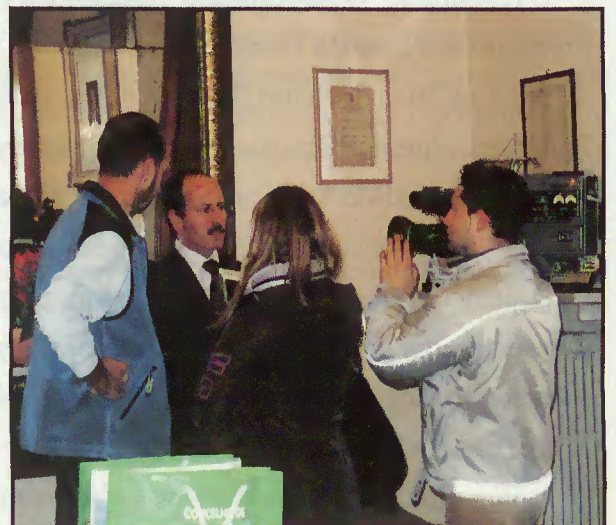
Presidente da autarquia fala em Itália dos projectos da autarquia

Tendo em vista a troca de experiências, um grupo de pessoas ligadas ao Projecto “Território VS Sustentabilidade” com que o município de Terras de Bouro está a desenvolver em ordem a criar no Concelho um núcleo de produtos biológicos deslocou-se a Itália.