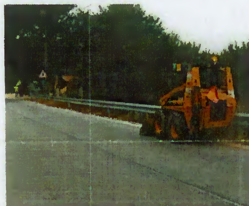
Execução das limpezas

da rectificação da estrada que liga Terras de Bouro a Rendufe.