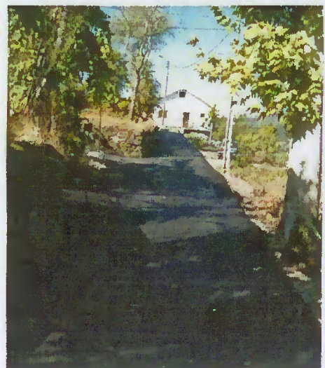
Pavimentação do acesso a Lajes

Desta forma, promove-se as melhores condições de vida e de acessibilidades aos lugares contemplados.