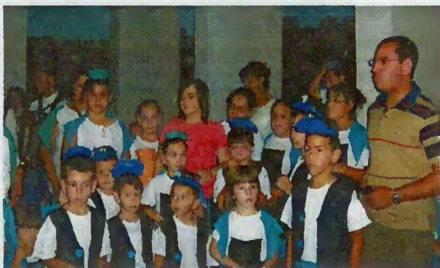
Crianças do Centro Social

que promoveram as Águas do Fastio, a representante das Termas do Gerês, o Grupo Trevo Alegre e do Pároco de Moimenta que falou da componente religiosa das Festas Concelhias. Óptima oportunidade aproveitada para falar de Terras de Bouro.