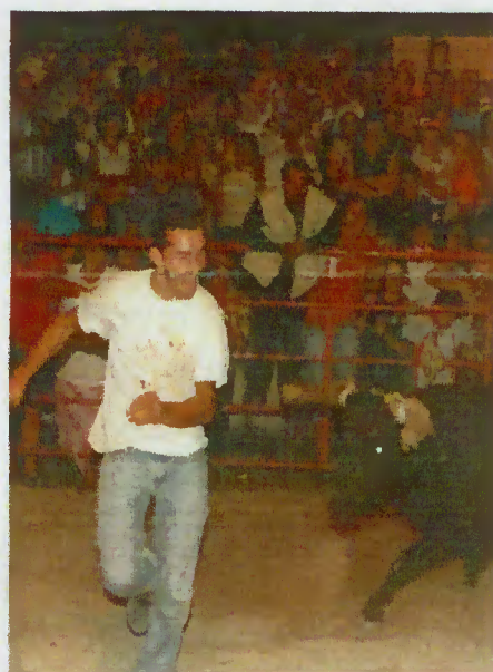
Touros animaram festas

o folclore, as corridas equestres, os produtos locais e a cerimónia religiosa. No programa deu-se ênfase à participação das Associações terrabourenses.