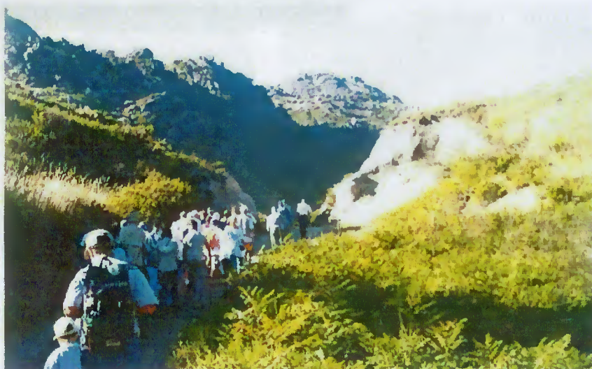
Turistas no Gerês

O Concelho registou um aumento significativo da procura turística que se deve à constante promoção e projecção do concelho no exterior, nacional e internacionalmente, feita pela Câmara Municipal, bem como a criação pela autarquia de motivos e infra-estruturas de apoio ao turismo, tal como pela aposta no turismo rural, a existência de empresas de desportos na natureza e por muitos empresários locais que têm melhorado os seus serviços.