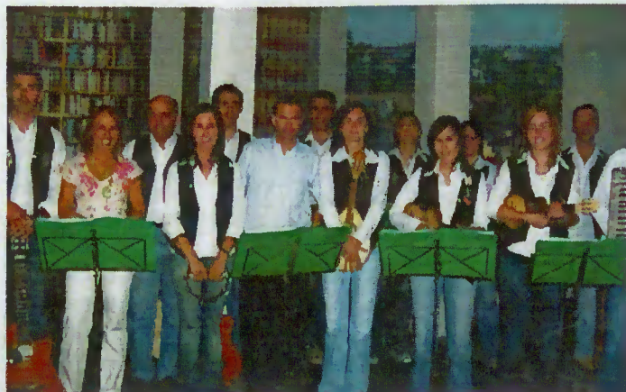
“Trevo Alegre” e apresentadores da “Praça da Alegria”