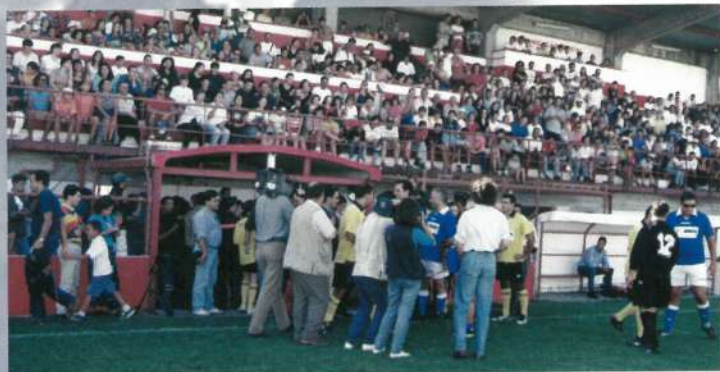
Semana da Juventude 1997