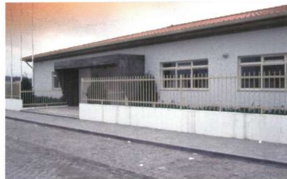
Edifício da ASCRA em Apúlia