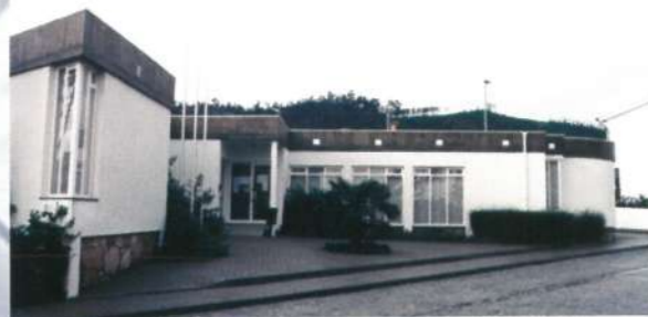
Sede da Junta de Freguesia de Palmeira