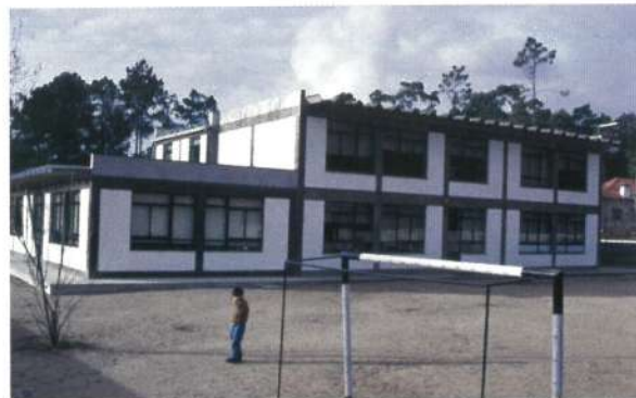
Escola de Góios - Marinhas