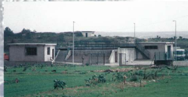
ETAR (Estação Tratamento Águas Residuais) - Marinhas

coabrindo 100% da população concelhia, ficando mais de 70% servida com saneamento, devidamente tratado através de Estações de Tratamento.