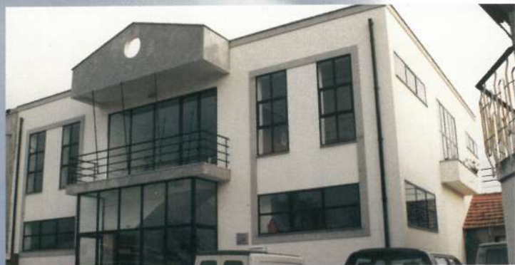
Sede dos Escuteiros de Marinhãs