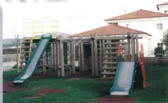
Parque Infantil - Fão