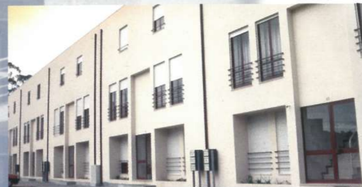
Habitação Social - Fão