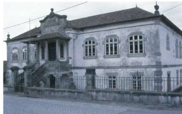
Escola Rodrigues de Faria - Forjães (futuro Centro Cultural)