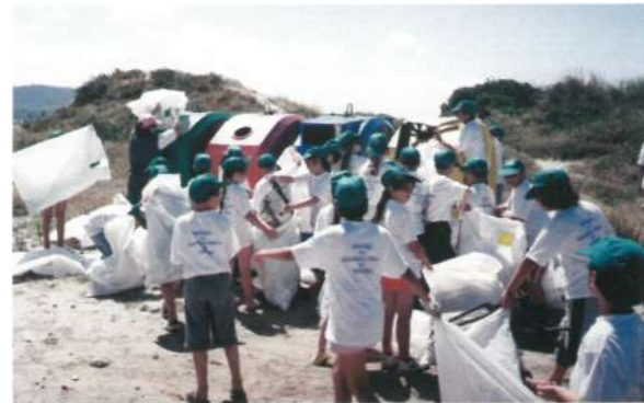
Campanha do Ambiente