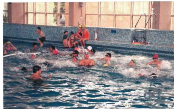
Desporto Escolar - Natação