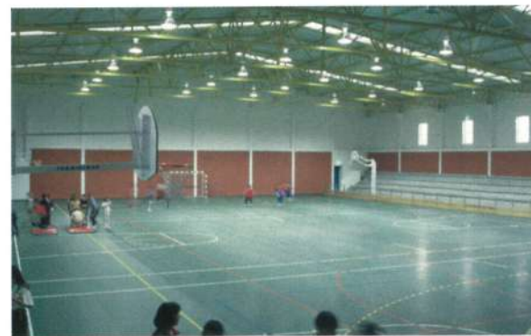
Pavilhão Gimnodesportivo de Apúlia