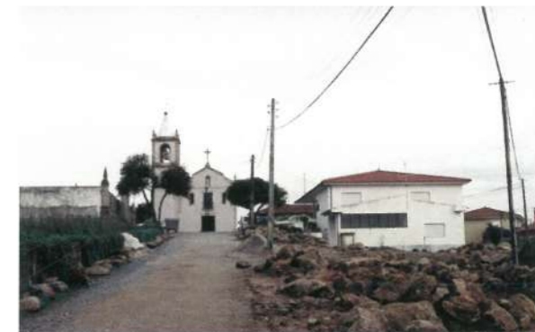
Envolvente do Centro Cívico de Rio Tinto