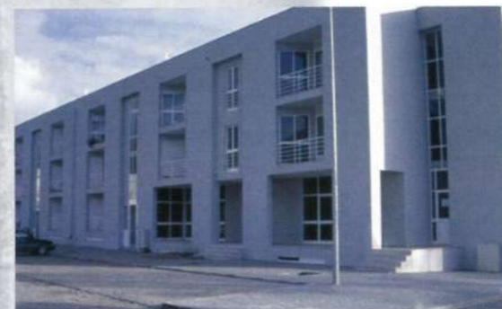
Habitação Social - Palmeira