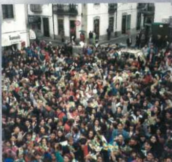
Semana da Juventude 1996