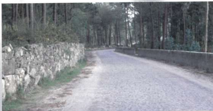
Estrada Real - Marinhas

Av. de S. Martinho , em Gandra, Acesso a Ofir , em Fão, Estrada de Apúlia a Ofir , etc. Refira-se que se aproveitou o facto de se estar a instalar a rede de saneamento e água no concelho para a Renovação de Vários Quilómetros de Novos Pisos em vários pontos do concelho. Em colaboração com a Comissão Nacional de Fogos Florestais, procedeu-se à Abertura de Vários Caminhos Florestais , permitindo um melhor acesso aos montes e matas.