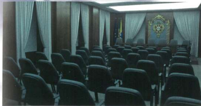
Edifício da Câmara Municipal - Salão Nobre

Curvos e Marinhãs, tendo sido adquirido um imóvel para instalar a Junta de Freguesia de Fão. Dotaram-se as freguesias com viaturas próprias , dando-lhes, por isso, mais autonomia e possibilidade de melhor servir a sua terra.