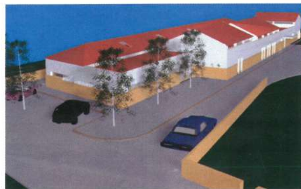
Maquete do Centro Social de Vila Chã