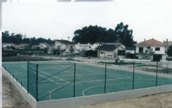
Campo Polidesportivo de Pedreiras - Fão