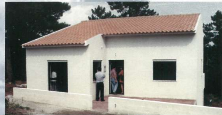
Habitação recuperada pela Associação Esposende Solidário - Antas