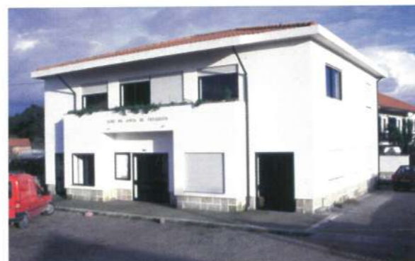
Sede da Junta de Freguesia de Gandra