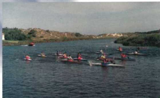
Prova de Canoagem