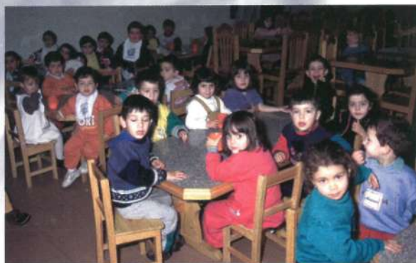
Apoio aos mais jovens