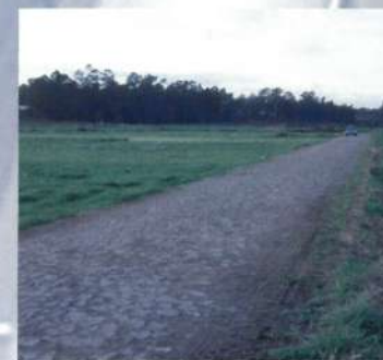
Caminho Agrícola da Fonte Boa