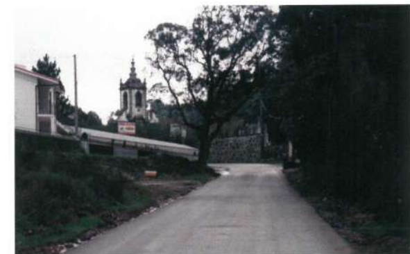
Estrada Antas - Forjães