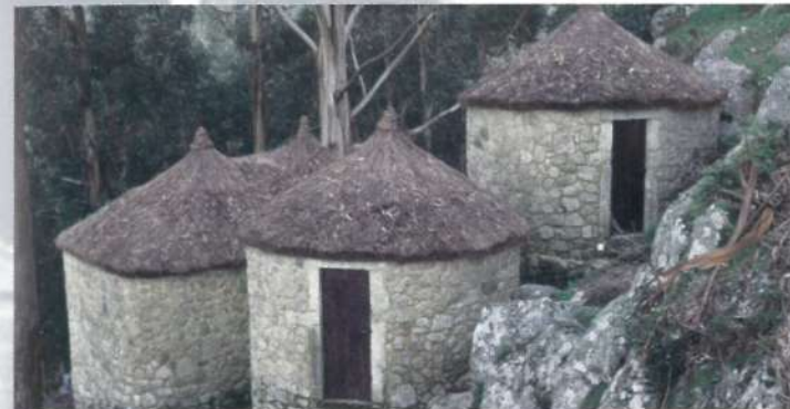
Castro de São Lourenço - Vila Chã