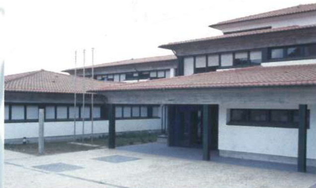
Centro de Saúde de Esposende