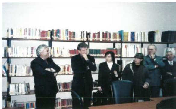
Polo de Leitura de Fonte Boa