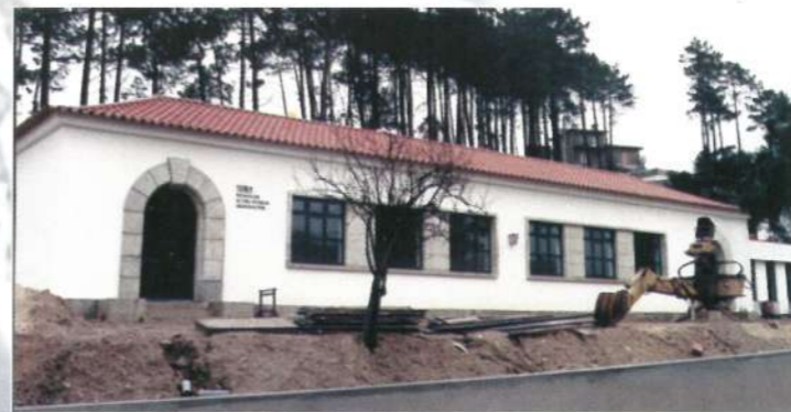
Escola de Azevedo - Antas

o Ministério da Educação visando o alargamento dos horários pós-escolar , apoiando, através dessas medidas as famílias que trabalham.