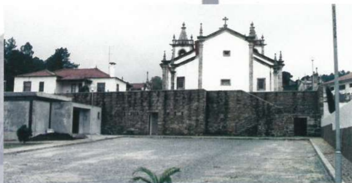
Envolvente da Igreja de Curvos