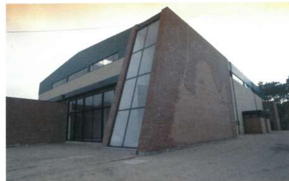
Pavilhão Gimnodesportivo de Fão