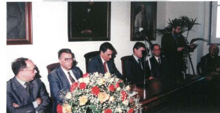
Inauguração do Hospital de Esposende