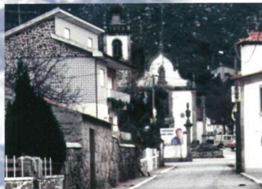
Rua de Belinho - Saneamento Básico