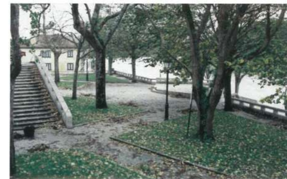
Barca do Lago