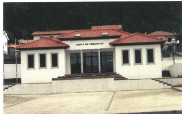
Sede da Junta de Freguesia de Mar