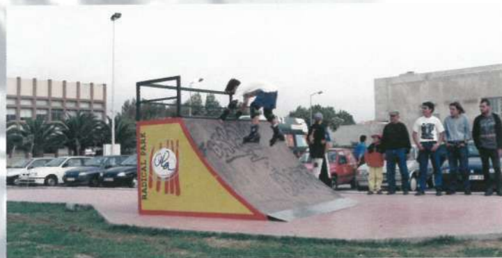
Parque Radical - Esposende