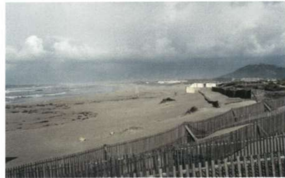
Defesa da Orla Costeira