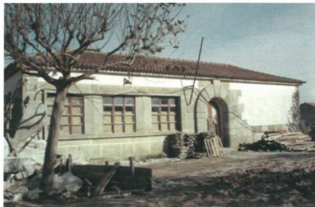
Futuro Centro de Saúde de Apúlia