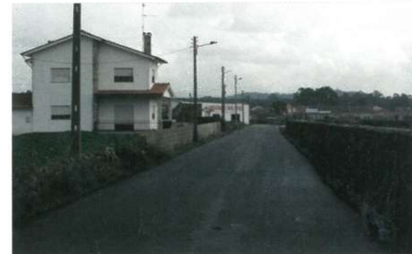
Av. São Martinho - Gandra