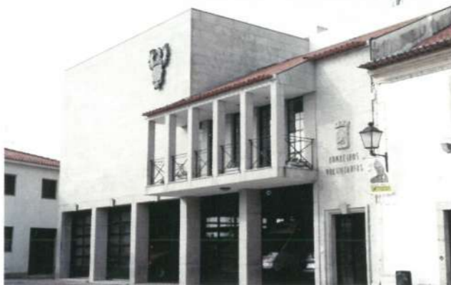
Quartel dos Bombeiros de Fão