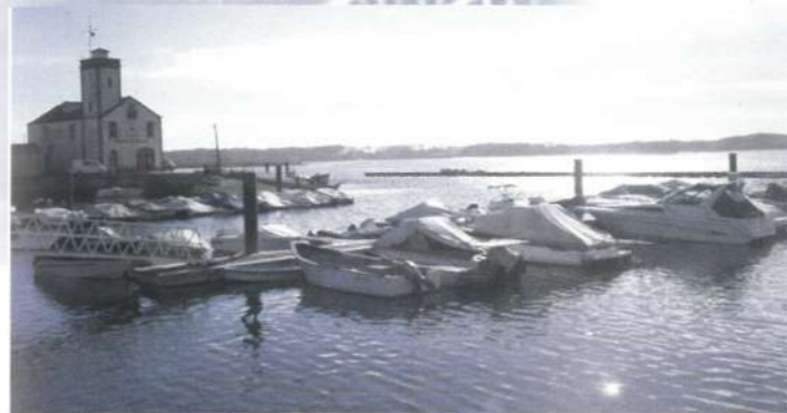
Docas de Recreio