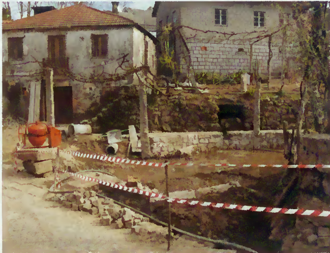
Execução de obras no centro do lugar

A Câmara Municipal, em parceria com a Junta de Freguesia, está a requalificar a ribeira e espaço público no centro da Freguesia de modo a embelezar aquele espaço e criar um espelho de água com proveito para os moradores, tornando mais digno o centro da Freguesia.