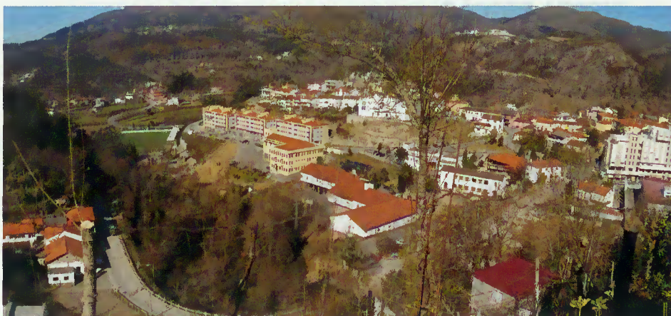
Vista panorâmica da Vila de Terras de Bouro

Com a publicação da Lei n.º 31/2005, de 28 de Janeiro, a sede do Concelho deixou de denominar-se Vila de Covas e passou a chamar-se Vila de Terras de Bouro, incluindo os lugares do Barreiro, Corredoura, Covas, Monte, Paço e Pesqueiras da freguesia de Moimenta.