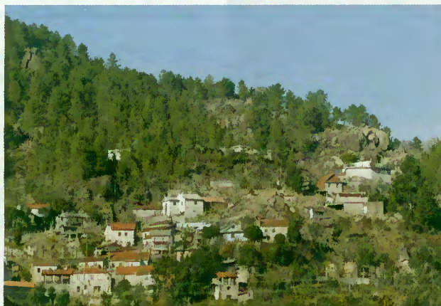
Vista panorâmica da Ermida/Vilar da Veiga

das condições de vida e de procura turística de uma aldeia afastada, mas de grande dinamismo.