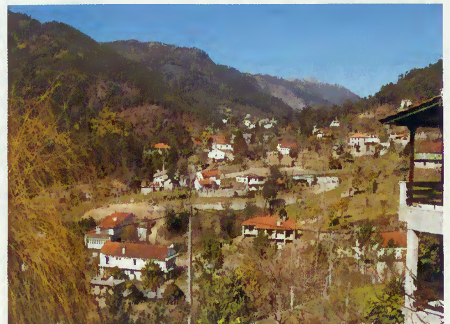
Núcleo urbano central de Pereiró

O prazo de execução é de 180 dias e o valor da empreitada é de 1.060.417,00 € + IVA.