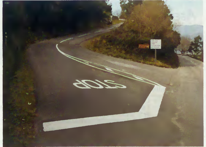
Pavimentação e sinalização de forma a criar segurança

A Câmara Municipal melhorou a pavimentação a estrada municipal entre Choreense, Santa Isabel e os lugares de Travassos e Santa Comba (Chamoim), aproveitando para efectuar sinalização de forma a criar mais condições de segurança, nomeadamente em épocas de nevoeiro.