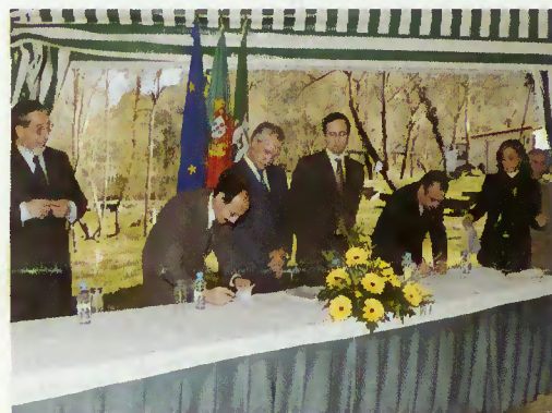
Presidente da Câmara e representante das Estradas de Portugal assinam Contrato/Programa

em partes iguais, a execução daquela obra para a qual já existe projecto aprovado.