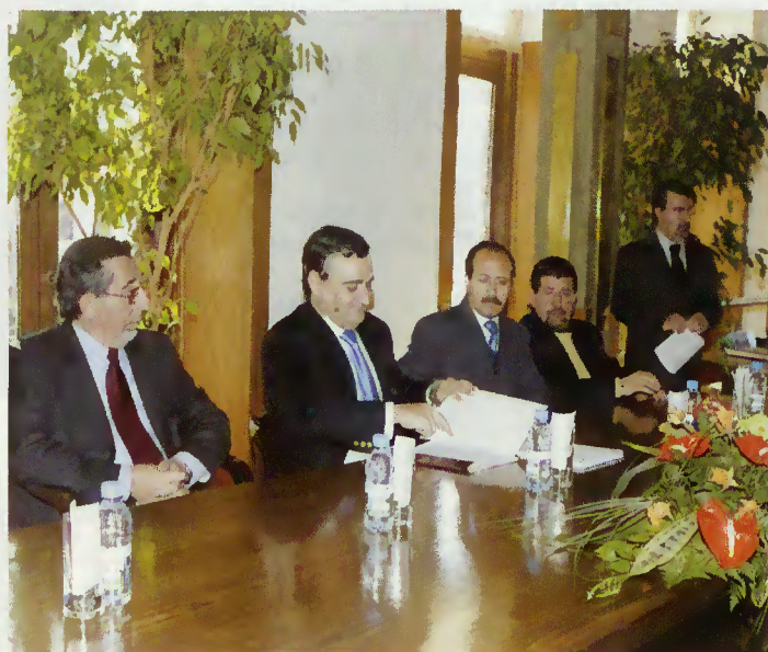
Secretário de Estado Adjunto homologa a abertura do concurso

instalações e que é uma má imagem que dá ao Gerês o edifício em degradação à entrada da vila.