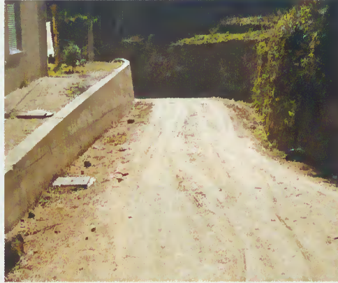
Intervenção na rua do lugar do Monte

O lugar do Monte, na freguesia de Moimenta, beneficiou do alargamento de uma rua que permite acesso alternativo ao centro da Vila, possibilita melhores condições aos moradores e obrigou à construção da rede de água e de saneamento.