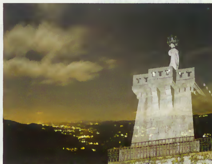
Visão nocturna do Bom Jesus das Mós e Vale do Homem