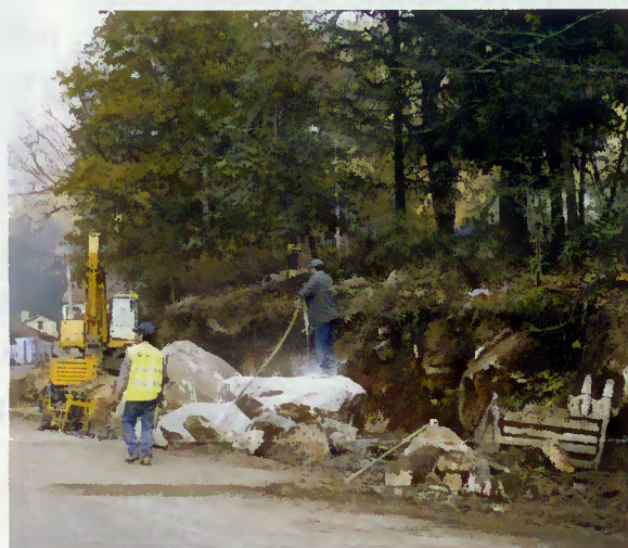
Alargamento da via para construção de rotunda

Já começaram as obras de acesso à variante do Gerês que inclui a construção de uma nova ponte na Assureira. Desbloqueados os terrenos de acesso à nova ponte e obtida a excelente colaboração do Parque Nacional da Peneda-Gerês para a construção de uma rotunda na Assureira, as obras já poderão concretizar-se.