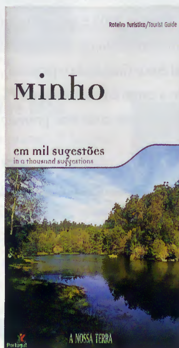
Capa do livro

O Roteiro é um excelente manual de informação bilingue que os empresários turísticos poderão adquirir, junto da