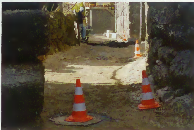
Um dos momentos da execução das obras

O lugar de Rebordochão em Santa Isabel vai passar a usufruir da rede de saneamento básico cujas obras estão a ser executadas pela firma URBANOP pelo valor de 17.415,00 euros, tendo os moradores colaborado com a passagem da referida rede que vai melhorar as condições de habitabilidade naquele lugar.