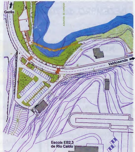
Desenho e enquadramento das obras em execução

Paredes e o Centro Náutico de Rio Caldo.