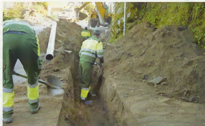
Trabalhadores da autarquia executam as obras

A Câmara Municipal executou, por administração directa, a ligação do ramal de saneamento da parte alta da Seara até ao S. Bento. Apesar de ser um ramal curto, foi muito oneroso e difícil de executar, dadas as condições geológicas (granito) encontradas no traçado. Todavia, para os moradores foi importante a sua concretização.