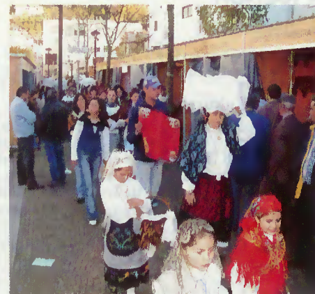
Desfile de trajes regionais

A Feira-Mostra foi uma oportunidade para a compra e consumo de produtos da terra e artesanato, para a mobilização informativa através de palestras e para a animação pelas colectividades locais.