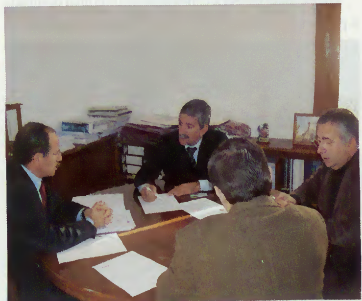
Reunião com a Direcção da EDP

da energia para as novas instalações da Pousada da Juventude e para as Portas do Parque, no Campo do Gerês, bem como a necessidade de mudança de local de um poste de alta tensão em Pesqueiras.