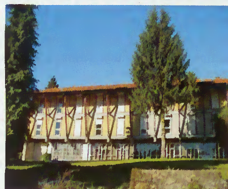
Pousada da Juventude que vai ser requalificada

de visitantes e que traz para Terras de Bouro investimentos jamais realizados.