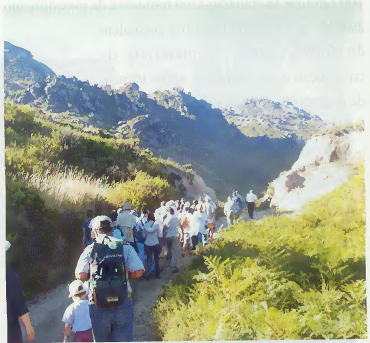
A Rede de Trilhos "Na Senda de Miguel Torga" foi muito procurada

A Câmara Municipal continuará a divulgar o Concelho e a encorajar os empresários de hotelaria a apostar na qualidade de serviços, única forma de consolidar o crescimento.