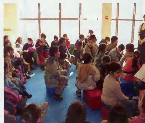
Crianças assistem ao ateliê

o gosto pelos livros e textos de variada natureza.