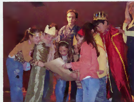
Crianças das escolas do vale do Cávado