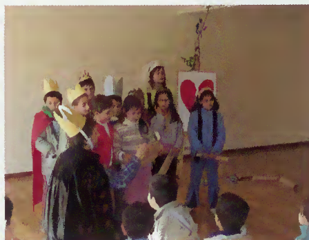
Crianças das escolas do vale do Homem

Estão previstas diversas actividades, nomeadamente ateliês artísticos, horas do conto, encontro com escritores, jogos pedagógicos, animação de leitura, ateliês artísticos – animação de histórias, etc., que visam promover um maior interesse pela leitura e o despertar na criança