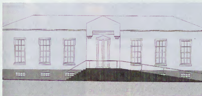
Fachada principal das futuras instalações do Posto da GNR

próximo ano, um vez que o Senhor Ministro considerou aquela obra como prioritária, tal como já havia sido considerado pelo Sr. Comandante Geral – General Mourato Nunes na deslocação ao Gerês, aquando da inauguração das instalações para fins sociais daquela Entidade e seus familiares.