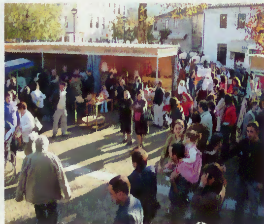
Muitos foram os visitantes