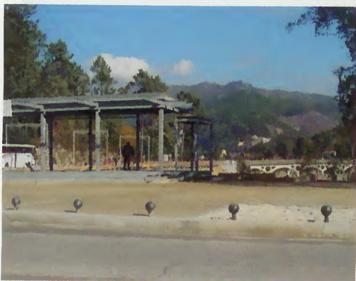
Antevisão do futuro posto informativo

um lugar convidativo à paragem para fruir a beleza daquele espaço à entrada do Concelho de Terras de Bouro que também passará a contar com um posto informativo para acolher e encaminhar quem quiser procurar orientações sobre a visita à região.