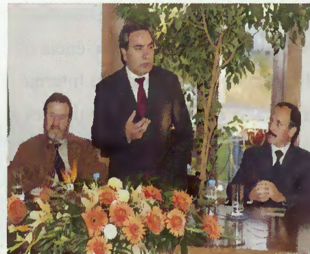
Secretário de Estado elogia o trabalho da Câmara Municipal

para a instalação na região de uma Central de biomassa destinada ao aproveitamento dos resíduos florestais.