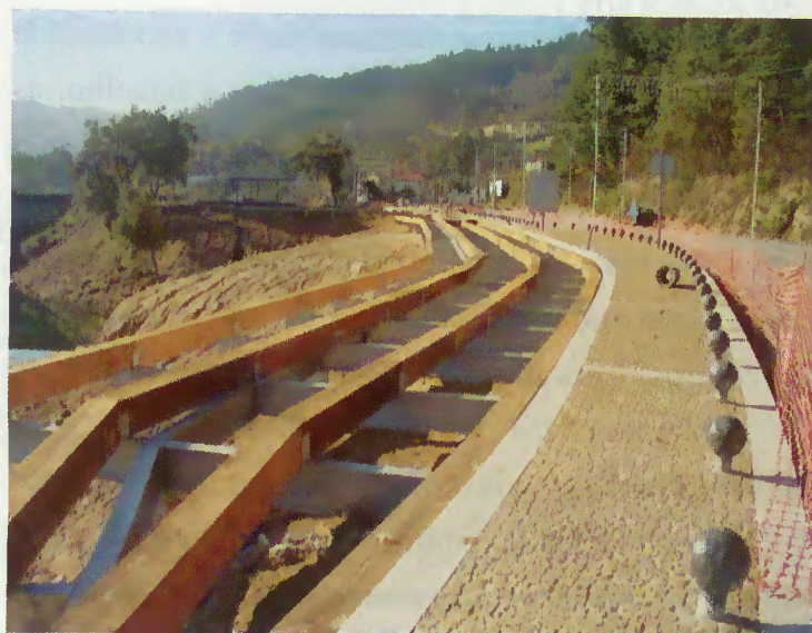
Espaço destinado a percurso pedonal