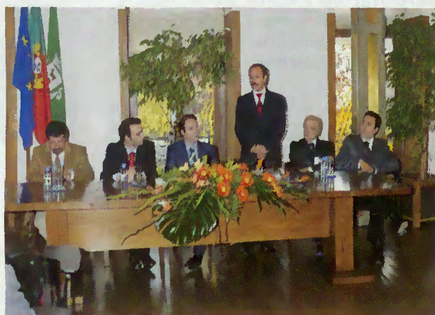
Presidente da Câmara Saúda Secretário de Estado