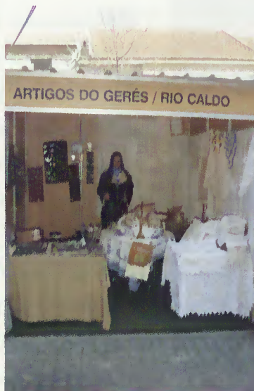
Um dos stands de produtos locais