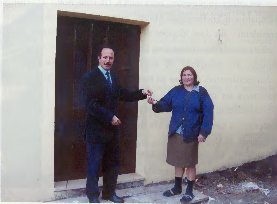
Presidente da Câmara entrega chave de habitação

intervenção em mais algumas habitações e o município tem prestes a iniciar a construção de loteamento social na freguesia de Carvalheira para 12 famílias, sendo o primeiro de um lote protocolado com o INH que prevê a construção de cerca de 40 fogos.