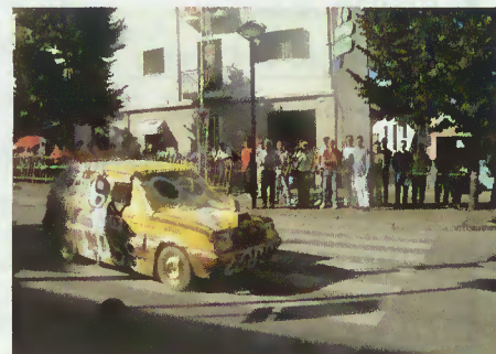
Prova de perícia automóvel