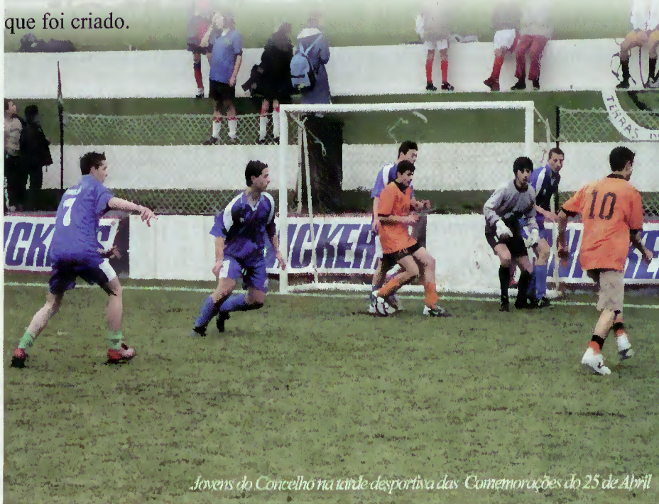
Jovens do Concelho na tarde desportiva das Comemorações do 25 de Abril

Apesar de o Clube de Terras de Bouro atravessar dificuldades, não vão faltar terrabourenses que saberão honrar os pergaminhos da Sua Terra e o futebol vai seguramente continuar em Terras de Bouro, utilizando aquelas instalações e apostando ainda mais nas várias competições de jovens do Concelho, o que prova que o relvado sintético do Campo Municipal de Terras de Bouro é muito útil e continua(rá) a cumprir os objectivos para que foi criado.