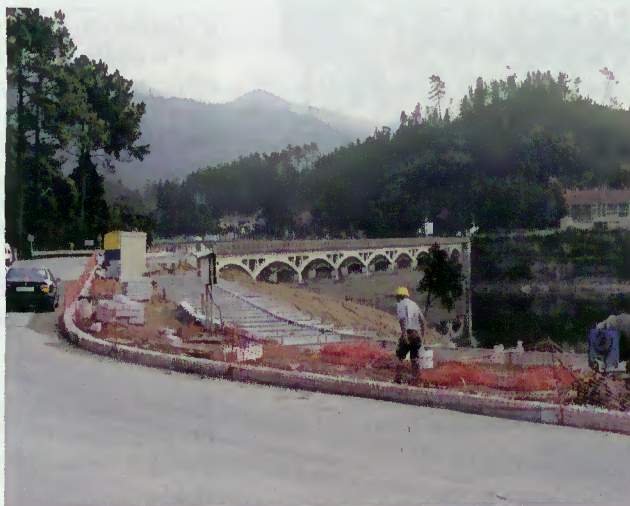
Fase de execução das obras

para o uso de praia, desde a ponte de Saltos (Vilar da Veiga), passando por Rio Caldo até Valdozende.