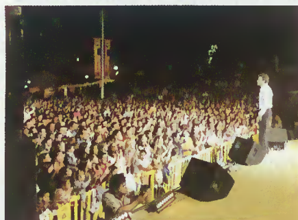
Tony Carreira saúda o público