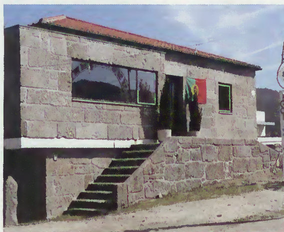
Visão parcial do edifício