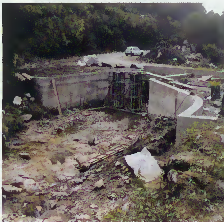
Intervenção na zona ribeirinha

Assim, a autarquia em colaboração com a ATACHA, criou, em Brufe, um espaço para aproveitamento de lazer em local ribeirinho/praias fluvial.