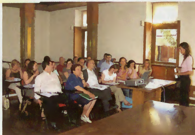
Momento da apresentação do trabalho realizado

O Programa da Rede Social, que foi lançado há cerca de meio ano, está a preparar a carta Social do Concelho pelo que, para além de ter criado o Concelho Local de Acção Social, constituiu duas equipas sectoriais, realizou o Pré-Diagnóstico Social do Concelho que leva todos os parceiros e instituições locais, não só a terem uma visão profunda do Concelho, mas também a determinarem as medidas a seguir de forma a que haja uma directriz de actuação das políticas sociais do Concelho.