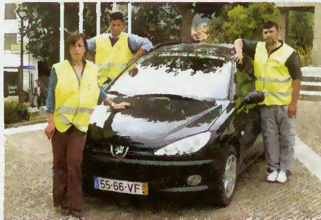
Elementos da brigada móvel

Além da brigada de limpeza de acessos a zonas florestais, a autarquia conseguiu a aprovação de uma brigada de vigilância móvel, durante o Verão, e apetrechada com equipamento e viatura cedida pelo Ministério da Administração Interna.