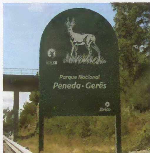
Sinalização colocada em Celeirós

Concelhos mais próximos daquela via. É mais uma forma de promoção turística.