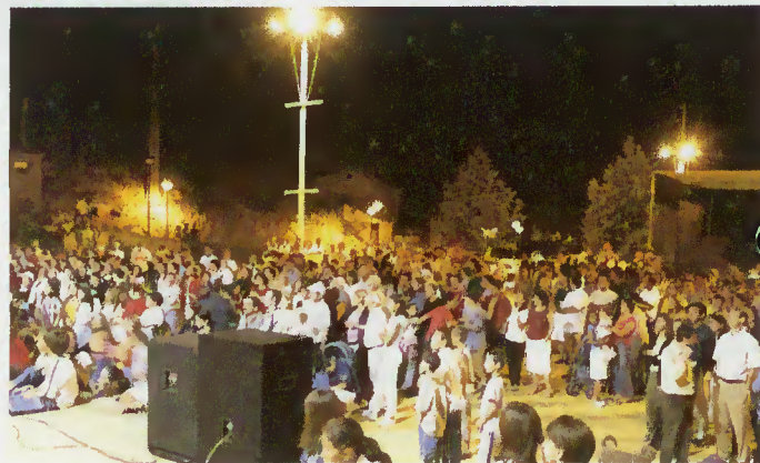
Público aprecia os participantes