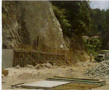
Muro de suporte

Um caso concreto é o investimento na construção de um muro de suporte, em Moimenta, para suportar casas recentemente construídas.