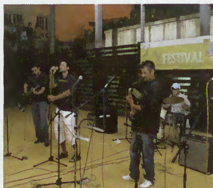
Vencedores do escalão juvenil

No passado dia 17 realizou-se o V Festival da Canção organizado pela autarquia e que contou com a participação da Associação de Souto e da Ribeira, do Grupo de Jovens de Chorense, da Ass. Núcleo Rio Homem, da Juventude de Valdozende, da Ass. de Paradela, da Ass. Asas Livres e Bombeiros.