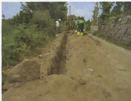
Execução da conduta

Desta vez, adquiriu uma nascente, em Real, onde melhorou a captação a fim de abastecer Quintela, sede do Concelho e lugares vizinhos.