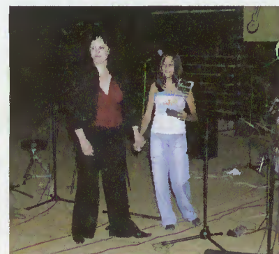
Vencedora do escalão infantil