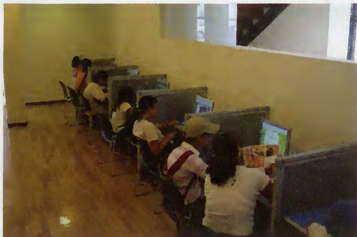
Visão geral do equipamento

Depois da abertura na Vila do Gerês, a Sede do Concelho foi também contemplada com o Espaço Internet cujo funcionamento enriquece a nossa terra ao proporcionar aos residentes e visitantes condições para usufruírem das novas tecnologias da informação.