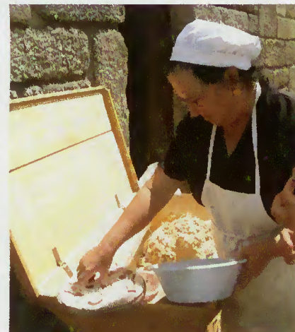
Confecção do bolo de presunto

Realizou-se no dia 18, no Campo do Gerês, a III Mostra Tradições - História, Gastronomia e lazer que foi uma oportunidade para reviver os costumes da vida rural, servindo também para a promoção dos produtos locais.