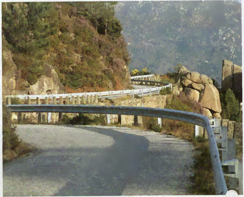
Colocação de rails na estrada da Ermida

No entanto, na procura de prevenir situações de perigosidade, tem apostado na rectificação de traçado de algumas vias, eliminação de curvas e colocação de rails de protecção, na estrada para a Ermida. Outros locais foram contemplados como o lugar de Cecêlo, a caminho da Fronteira da Portela do Homem, o lugar de Assureira – junto ao Banco do Ramalho e o Campo do Gerês, à entrada da aldeia. Outros investimentos continuam a ser realizados, apesar das restrições económicas conjunturais também impostas às autarquias.