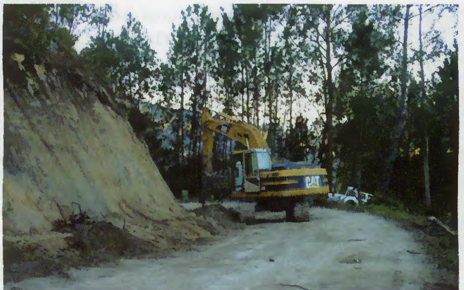
Alargamento de curva na Balança