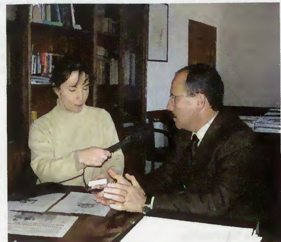
Presidente apresenta à correspondente da BBC-News as potencialidades do Concelho

Outras iniciativas vão surgir. Importa que os empresários se modernizem e se unam em termos de promoção turística.