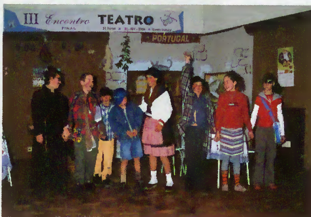
Actores de "Os Crónicos"

serem apresentadas duas pequenas comédias "As Respostas do 39" e "Ressonar sem Dormir" levadas a cena pelos formandos do Curso de Teatro, organizado pela Câmara Municipal e orientado por técnico do INATEL.