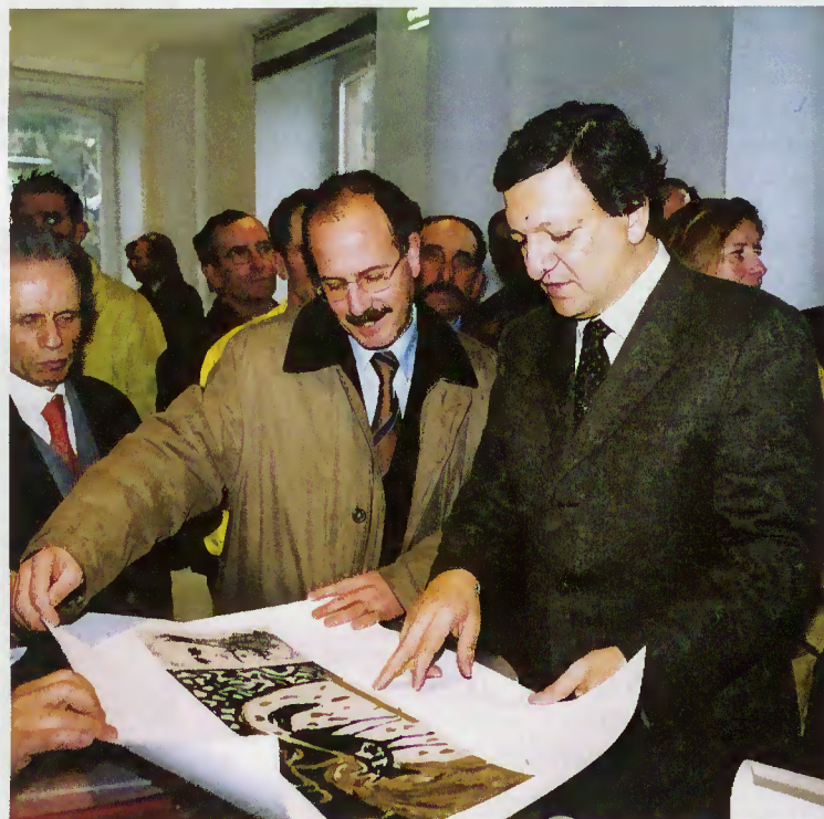
Primeiro-Ministro aprecia oferta da Câmara Municipal

Sua Excelência o Primeiro Ministro prometeu o empenho na candidatura da Geira a Património da Humanidade.