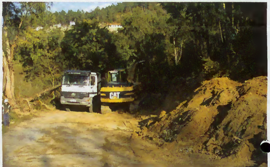
Alargamento de curva entre Ribeira e Souto

curvas, consideradas pontos críticos, nas freguesias da Balança, da Ribeira e de Souto.