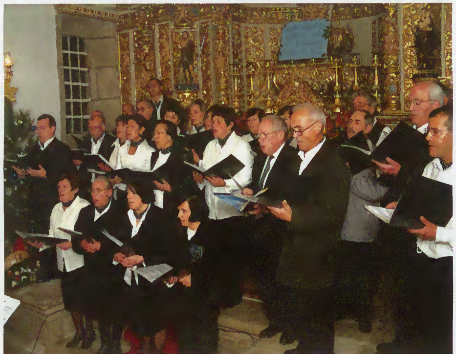
Momento da Actuação

Paróquia e Junta de Freguesia de Rio Caldo que patrocinaram o evento. Tendo a actividade sido do agrado dos ouvintes, o público solicitou que se criassem outras oportunidades, ficando aberto o caminho para futuros intercâmbios entre as Associações de Terras de Bouro e de Montalegre.