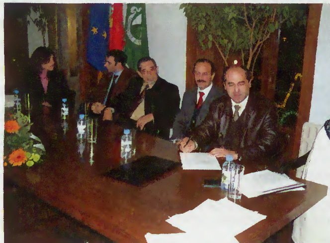
Momento da assinatura da escritura

a EDP relativamente à clarificação de situações, como o Bairro da EDP, em Paradela.