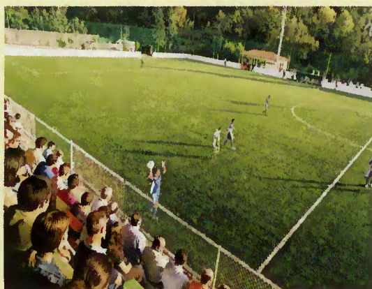
Agora é mais atractivo praticar desporto.

Neste sentido, a Câmara Municipal informa todos os interessados, de modo especial as Associações, que