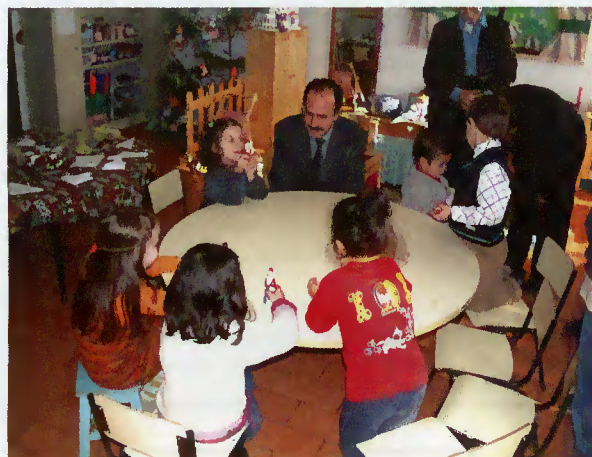
Presidente conversa com as crianças

Refira-se que, no próximo ano, haverá um aumento significativo de crianças a frequentar aquela escola.