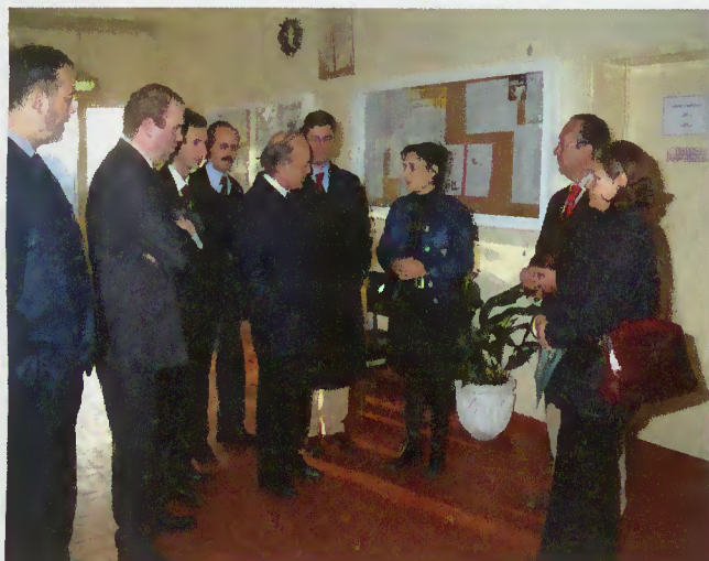
Visita à Escola P. Martins Capela

Comunicação Social o regozijo pelo dinamismo e determinação da autarquia em lutar por projectos de desenvolvimento do Concelho.