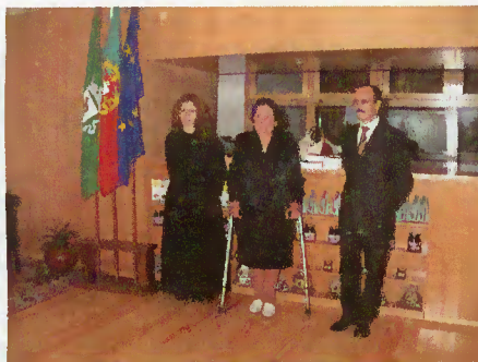
Centro de Produtos Locais