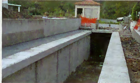
Linha de água no Gerês

Depois da intervenção urgente, aquando das intempéries de há dois anos, a autarquia executou obras de requalificação e preparação para escoamento de águas da linha de água junto dos Correios da vila do Gerês.