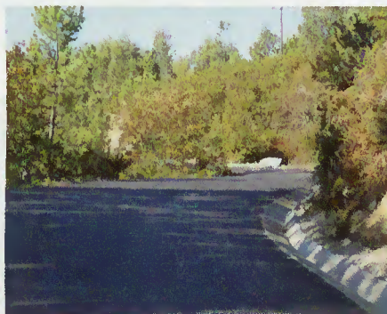
Requalificação de Via Municipal

como em Paradela, Admeus de Cima, Cruzes, Forcadeira, Gradouro a Carvalheira, etc.