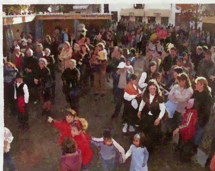
Visita aos stands

sobre o Projecto da Agricultura Biológica a implementar pela Câmara Municipal e a apresentação da Livraria Minho como distribuidora oficial do livro Trilhos Pedestres na Senda de Miguel Torga .