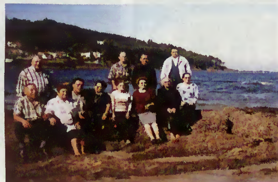
Terrabourenses na Galiza

vez. Assim, partiram do Concelho 12 idosos para uma semana de férias em Panxón, vindo satisfeitos com a iniciativa que lhes foi proporcionada.