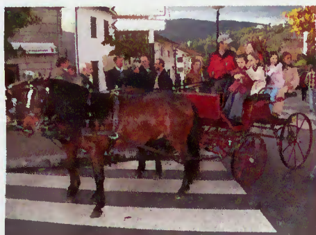
Animação da Feira

Apesar do mau tempo, os objectivos foram atingidos, tendo, ainda, sido inaugurado o Centro de Produtos Locais, o trilho do Couto de Souto e realizadas palestras diversas