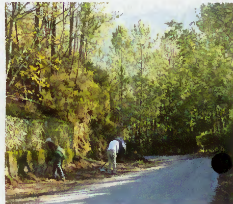
Limpeza de estradas