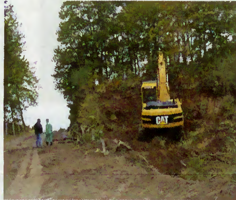
Execução de obras

Além disso, acautelou-se a segurança dos utentes daquela via.