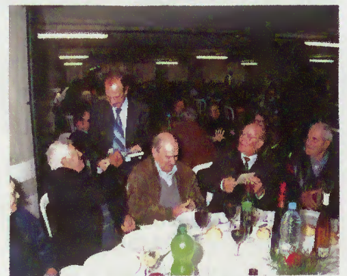
Almoço / convívio