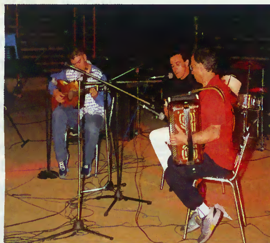
Actuação de um dos 19 concorrentes

oportunidade para a criação e desenvolvimento de talentos e potencialidades tantas vezes por descobrir e, sobretudo, promover o convívio e animação dos terrabourenses.