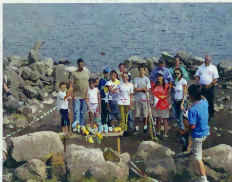
Jogo das latas

nos diversos escalões e a prova de orientação, a partir do Museu Etnográfico. De tarde, já nos terrenos da antiga aldeia de Vilarinho das Furnas, desenvolveram-se os jogos tradicionais e o I concurso de pesca desportiva.