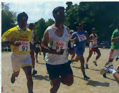
Início da prova de séniores - atletismo

A actividade constou de várias modalidades desportivas e de convívio. De manhã, houve provas de atletismo