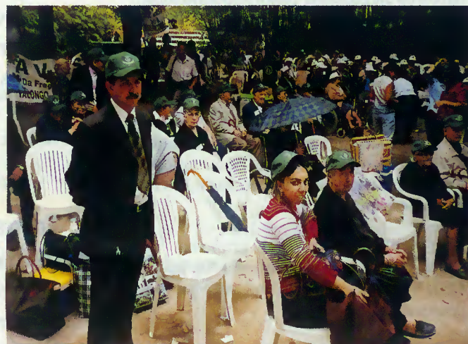
Terrabourenses na “Praça da Alegria”

Na organização desta actividade, foi possível contar com a colaboração dos centros sociais de Souto, Chorense, Rio Caldo, Valdozende e Lar da Cruz Vermelha.