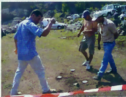
Jogo da malha

O evento esteve a cargo da Associação Cultural e Recreativa de Souto e do ARRCa do Campo do Gerês que trataram de toda a logística. Foi uma oportunidade não só para a prática desportiva, a preservação dos jogos tradicionais, mas também de convívio e para visitar os terrenos que restam da antiga aldeia de Vilarinho das Furnas, apreciando a paisagem idílica das Serras do Gerês e Amarela.