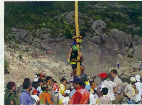
Subida ao pau de sebo

para aquisição de uma máquina de limpeza (roçadora);