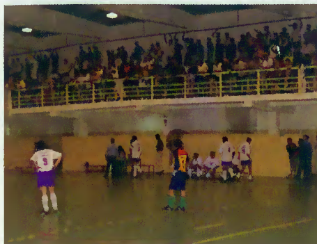
Momento do jogo

As equipas que disputaram o 3ª e 4ª lugar (Chamoim e Associação de Pais) defrontaram-se, às 21,00 horas, e os finalistas foram as associações de Covide e o Núcleo Rio Homem.