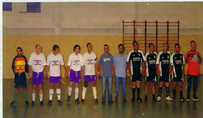
Finalistas do torneio

jovens que, semana após semana, participaram em actividades desportivas e proporcionaram o intercâmbio e convívio entre os jovens das várias