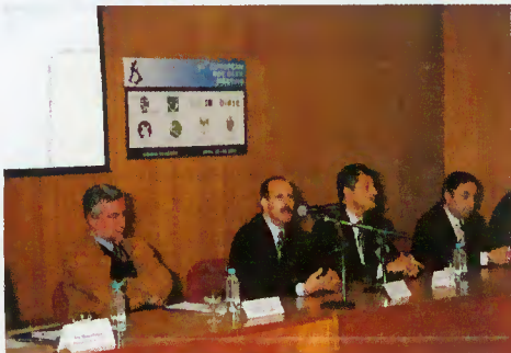
Sessão de Abertura

Nesta perspectiva, no dia 12 de Abril, a autarquia recebeu um grupo de jornalistas espanhóis, franceses e italianos que acompanhados pela Associação Industrial do Minho visitaram o Parque Nacional e foram recebidos pelo Grupo de Promoção Turística da vila do Gerês.