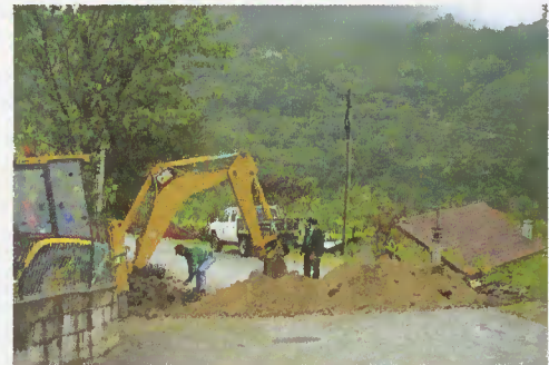
Abertura de vala

Entretanto, outras intervenções vão sendo feitas por todo o Concelho, dentro das possibilidades humanas e materiais do município. O executivo em diálogo com as Juntas de Freguesia, o esforço dos trabalhadores e técnicos, contando com a compreensão dos munícipes, tenta resolver as situações.