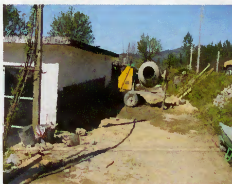
Execução de obras

Desta vez, executaram um muro de suporte no caminho de Ladário, em Choreense.