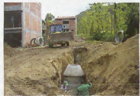
Rede de saneamento