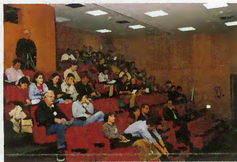
Participantes no Congresso