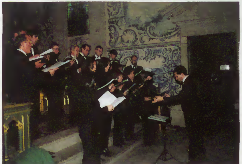
Grupo “Cappella Bracarensis”

Foi uma oportunidade para apreciar a brilhante execução do Grupo Coral Cappella Bracarensis , que apresentou um repertório alusivo à quadra da Páscoa e de sensibilização para a música clássica.