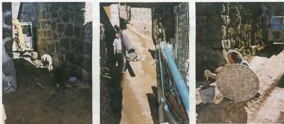
Saneamento Básico em Freitas

Há muito que os habitantes de Freitas haviam reclamado a melhoria do arruamento central. A autarquia, antes de proceder à repavimentação, aproveitou para colocar as infra-estruturas básicas de abastecimento de água, rede de saneamento básico e conduta das águas pluviais e de rega.