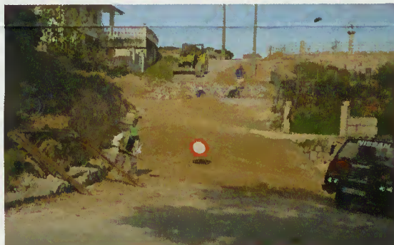
Acesso ao Miradouro - Covide

O Outeiro do Rei em Covide e os moradores circunvizinhos passaram a ter melhor acessibilidade com a reparação e repavimentação do caminho de acesso que veio a dignificar não só aquela espaço, como também a tornar-se um local de visita, possibilitando uma visão panorâmica da freguesia. A obra resulta da preocupação manifestada pela Junta de Freguesia cuja resolução a Câmara Municipal apoiou.