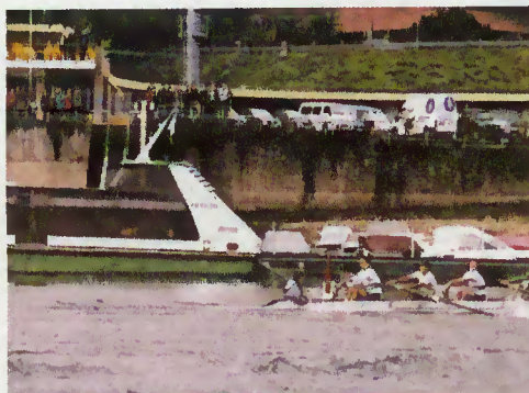
Marina - Rio Caldo

com as condições para a prática da modalidade, quer em termos de espelho de água, quer pelas infra-estruturas de apoio na Marina de Rio Caldo.