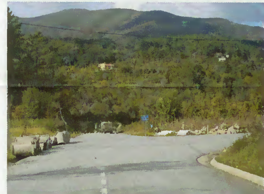
Pesqueiras - Início da Via do Homem