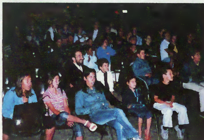
Cinema ao Ar Livre

É preocupação da autarquia colaborar na animação das Vilas do Gerês e de Terras de Bouro durante o Verão. Tendo começado no Gerês, no ano passado, agora estamos a dar os primeiros passos na Sede do Concelho. Assim, para além das actividades culturais e recreativas já consagradas, eis que apareceu cinema ao ar livre, no passado dia 20, em frente aos Paços do Concelho e ainda uma Noite de Fado, realizada em Terras de Bouro. De futuro, estudar-se-ão outras iniciativas.