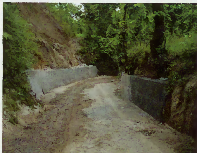
Muro de Sequeirós