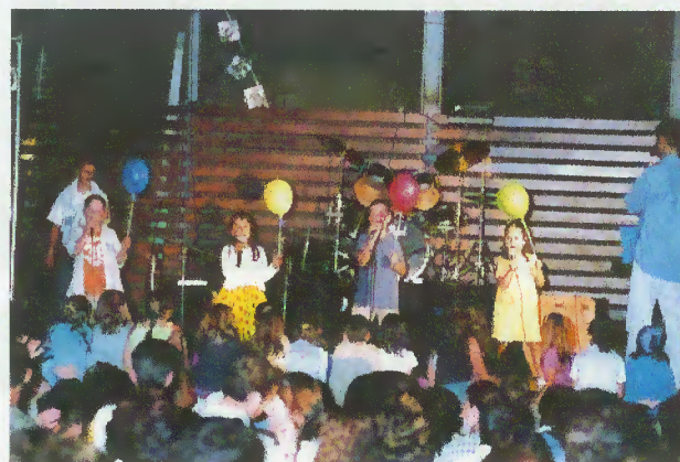
Canção Vencedora - Escalão Infantil

crescendo de ano para ano, foi objecto da apresentação de 15 canções originais na letra e na música, todas da autoria de terrabourenses que, através das associações locais, concorreram ao festival.