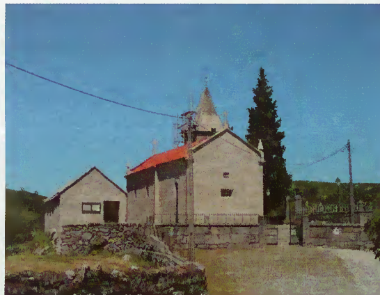
Igreja de Santa Isabel do Monte

A freguesia de Santa Isabel do Monte tem, pouco a pouco, recebido melhorias que a projectam como local de referência a visitar. Depois da Casa dos Bernardos e do lançamento de trilhos, chegou a vez de uma significativa intervenção na igreja e no recinto exterior, este último a cargo da Câmara Municipal que tratou do sistema eléctrico e da colocação de candeeiros enquadrados no conjunto do edifício.