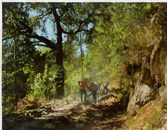
Abastecimento de água ao Lugar do Cadaval

Sendo um trabalho necessário é, todavia, muitas das vezes, dispendioso e moroso. No entanto, a autarquia prosseguirá de forma a melhorar a qualidade de vida dos munícipes, como é o caso do abastecimento de água ao lugar do Cadaval.