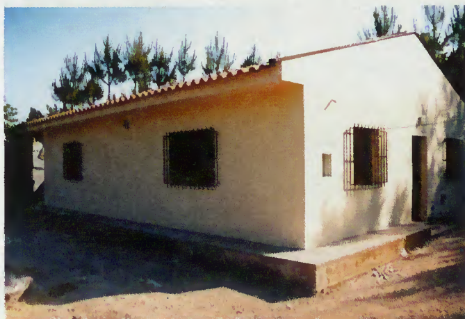
Um exemplo da recuperação de habitação

Como é objectivo do Projecto apoiar, até ao final do ano, a recuperação de mais 18 habitações, foi feito um pedido de reforço de verba ao Comissariado Regional da Luta Contra a Pobreza.