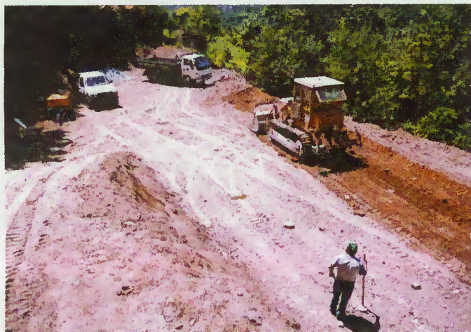
Obras de construção da Etar - Assento, Cibões

Esta obra foi adjudicada à firma URBANOP e cujo preço, com a aquisição de terrenos, ronda os 150 mil euros. É mais um passo em frente na qualidade de vida da população.