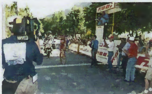
Grande Prémio ABIMOTA

Já no dia 28 teremos, às 12 horas, na vila de Terras de Bouro, a chegada da sexta etapa e às 16, a partida para a sétima etapa do 12.º Passeio a Portugal em Cicloturismo que seguirá por Covide e Rio Caldo em direcção a Gondomar.