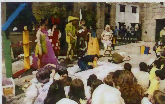
Peça de Teatro - "Hospital dos Brinquedos"

Num evento onde o contacto com o livro foi privilegiado, a primeira feira deste género a decorrer em Terras de Bouro registou a visita de muitos curiosos e ainda várias escolas, esperando-se, assim, que esta seja uma iniciativa com futuro.