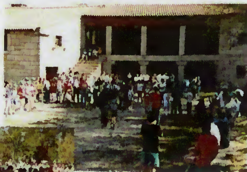
Convívio em S. João do Campo

O dia 25 de Abril foi aproveitado para as associações do Concelho realizarem o III Encontro Desportivo Concelhio que decorreu em S. João do Campo. Foram centenas de participantes que, desde as dez às dezassete horas, estiveram em pleno convívio, tendo-se até registado a presença de atletas vindos de fora do Concelho como prova da apetência pelas actividades que se vão desenvolvendo em Terras de Bouro.