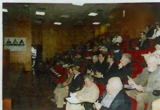
Auditório do Centro de Animação Termal do Gerês