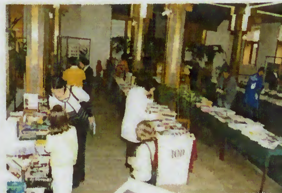
Feira do Livro

NOVO HORÁRIO DE FUNCIONAMENTO DOS SERVIÇOS ADMINISTRATIVOS DA CÂMARA MUNICIPAL DE TERRAS DE BOURO 8h30 - 16h30 (incluindo a hora do almoço)