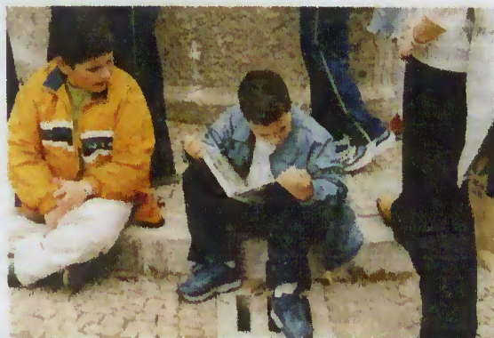
Feira do Livro