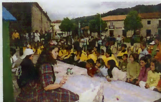
Peça de Teatro - "Hospital dos Brinquedos"