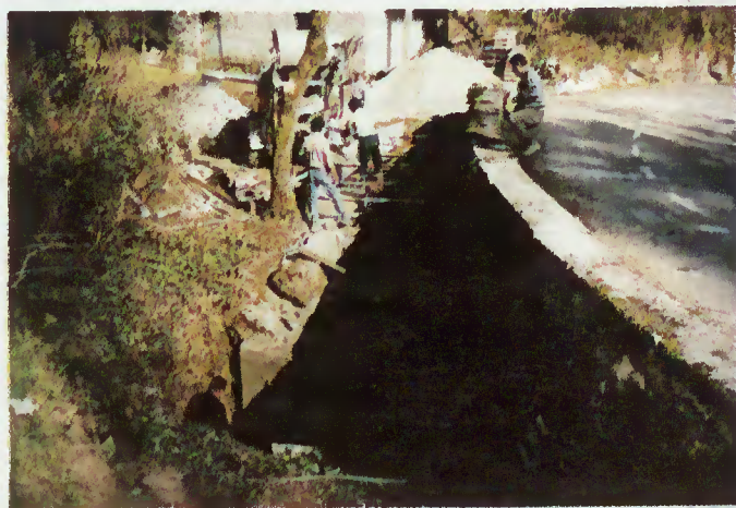
Alargamento da curva da Levandeira

fruição de um espelho de água ou um pequeno passeio no trilho dos peregrinos. Também a estrada do Chamadouro beneficiou de algumas melhorias. Depois da pavimentação e da instalação de infra-estruturas referentes às redes de abastecimento de água e de saneamento básico, a curva e a ponte da Levandeira foram alargadas, com o objectivo de maximizar a