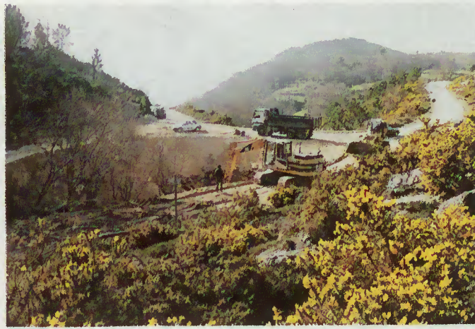
Melhorias na estrada Sta. Isabel/Valdozende