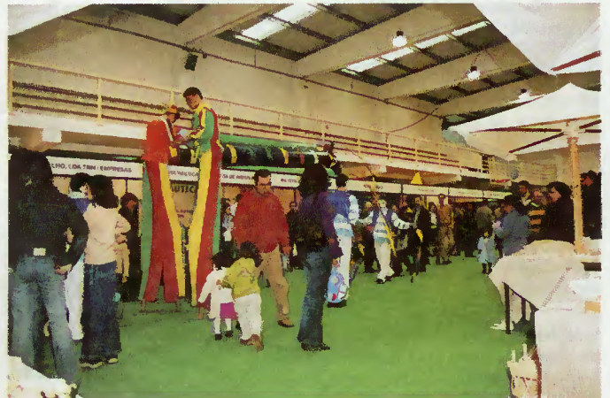
Animação na I Feira Económica