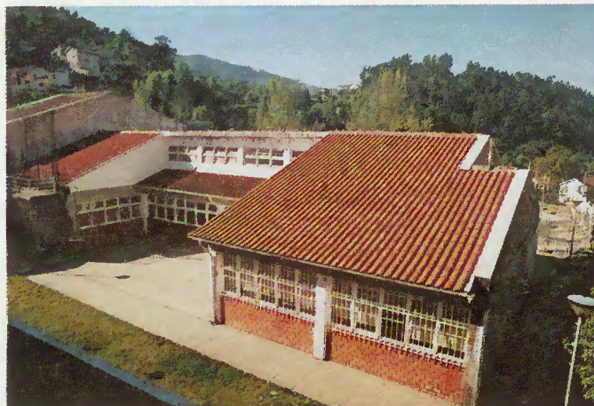
Escola EB 2,3/S Padre Martins Capela