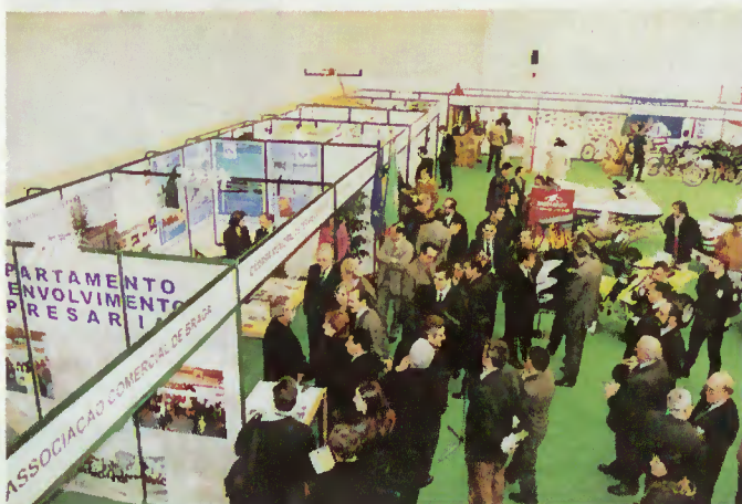
I Feira Económica - Expositores