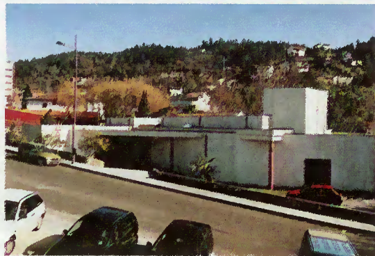
Futuras instalações da Biblioteca Municipal

O Executivo de Terras Bouro viu aprovada a candidatura apresentada para a criação da Biblioteca Municipal, cuja instalação se fará no actual Centro Cultural. Orçamentado em cerca de 180 mil contos, o projecto, orientado para o usufruto de toda a comunidade local, contará com sala de abertura, sala do conto, anfiteatro, arquivo, laboratório e sala de reprodução de documentos, espaço este dirigido por técnicos especializados. Para tal, o edifício em questão será alvo de uma transformação total de forma a tornar-se apto para receber, com todas as condições necessárias, esta biblioteca.