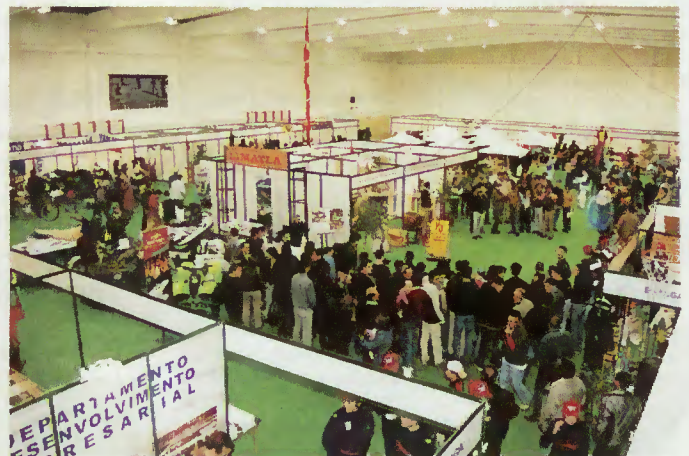
I Feira Económica - Expositores