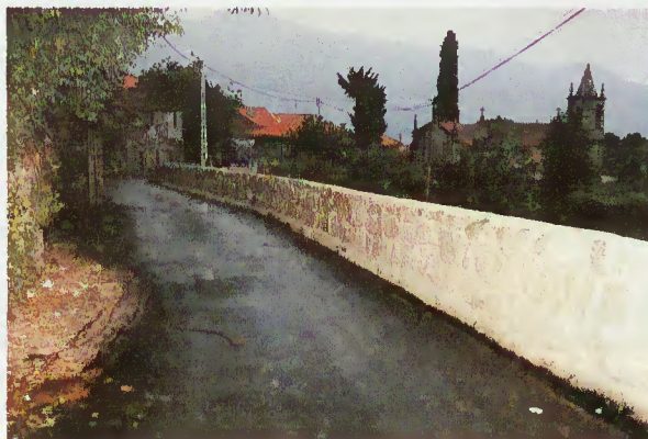
Caminho Municipal Quintão - Carvalheira

Os moradores de Quintão, da freguesia Carvalheira, viram a ligação ao lugar do Assento ser objecto de colocação de asfalto, depois de concluída a construção da rede de abastecimento de água e de saneamento. O Inverno prolongado provocou um atraso nas obras, causando, inevitavelmente, alguns incómodos aos moradores que, face a tais condicionalismos, mostraram-se compreensíveis e satisfeitos com os melhoramentos efectuados.