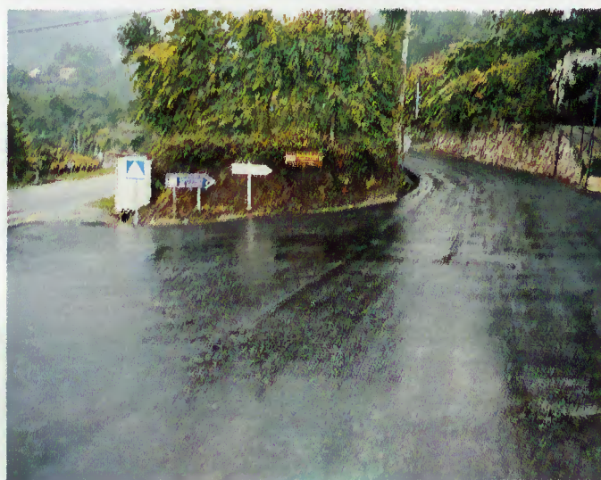
Rede viária intermunicipal Chamadouro - Vilarinho

A estrada intermunicipal que liga Valdozende ao Santuário da Sra. da Abadia e à sede do Concelho, foi alvo de uma intervenção significativa. Após a conclusão do projecto de saneamento básico e da rede de abastecimento de água nos lugares de Vilarinho, Vilar-a-Monte e Chamadouro, na freguesia de Valdozende, a estrada foi objecto de uma nova pavimentação. Esta obra surge na sequência da abertura e requalificação de toda a rede viária municipal, objecto de candidaturas a fundos comunitários.