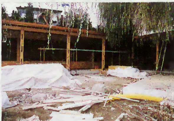
Pré-primária de Moimenta

A construção do novo edifício da escola pré-primária de Moimenta, cujos custos ascendem a 35 mil contos, avança a um ritmo vertiginoso. Dotada com duas salas de ensino e destinada a crianças entre os três e os seis anos de idade, esta nova escola vai dar resposta aos anseios colocados pelos pais no início do ano. Entretanto, as obras para a pré-primária de Chorense também estão em curso.