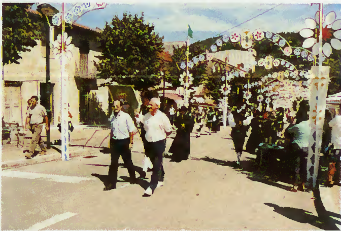
Cortejo Etnográfico - Banda de Lobios

de segunda-feira, ficando a tarde reservada para a prestigiosa e tradicional corrida de cavalos e a noite para a música popular.