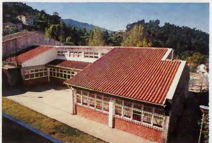
Escola E.B. 2,3/S Padre Martins Capela

do técnico superior da DREN, deverá “ser apresentado à comunidade nos fins de Outubro próximo”.