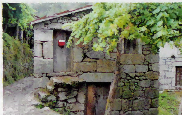
Programa AGRIS - Valorização de zonas rurais

A Câmara Municipal está a preparar um plano de intervenção para apresentar uma candidatura ao programa comunitário "AGRIS", enquadrado no âmbito do III Quadro Comunitário de Apoio. O objectivo do programa é garantir a promoção e o desenvolvimento das zonas rurais, nomeadamente através da preservação e valorização de pequenos aglomerados populacionais rurais, melhoria das condições de vida das populações e requalificação ambiental e agro-florestal. Esta iniciativa vai permitir um investimento de cerca de 500 mil contos nas freguesias de Carvalheira, Chamoim, Vilar, Choreense, Ribeira, Souto, Balança, Vilar da Veiga (Ermida), Rio Caldo (Seara) e Valdozende (Assento).