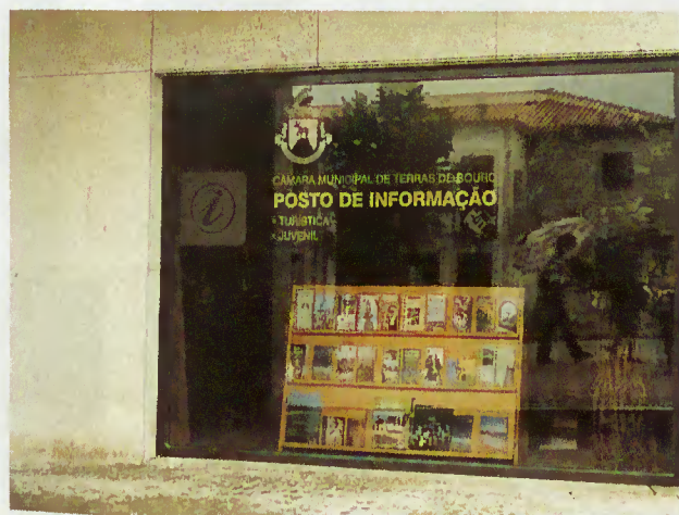
Posto de Turismo de Terras de Bouro