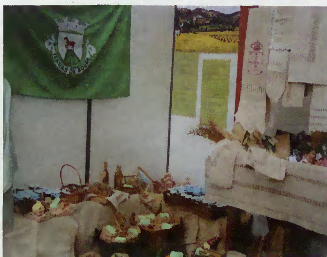
Stand de Terras de Bouro