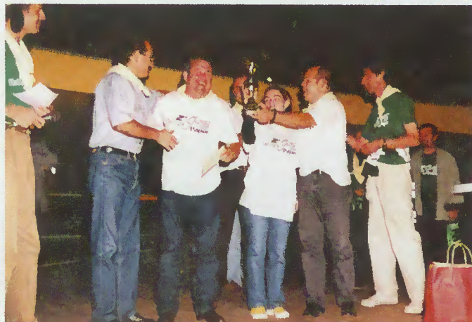
Entrega de prémios