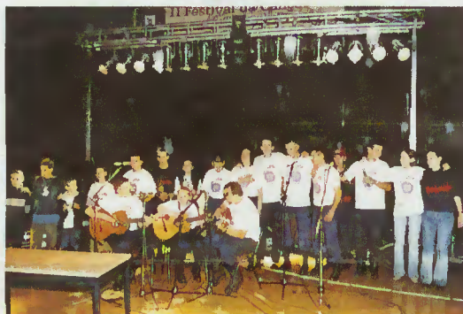
B. V. Terras de Bouro - Vencedor Escalão Juvenil