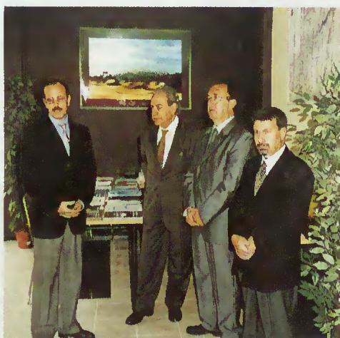
Cerimónia de Inauguração