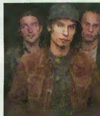
Hands On Approach

9h00 - Início da Feira Franca. 9h30 - Concurso de Gado Bovino e de Mel, organizado pela COATEB. 15h00 - Actuação da Banda Musical de Carvalheira - Terras de Bouro. 16h00 - Corrida de Cavalhos, organizada pela COATEB (Local: Av. Dr. Paulo Marcelino). 21h30 - Actuação do Grupo de Música Popular Trevo Alegre de Valdozende. 23h00 - Actuação do artista de Música Popular José Malhoa e a sua Banda (Local: Praça de Espectáculos). 24h00 - Encerramento das Festas Concelhias de Terras de Bouro/2001 com Fogo de Artificio.