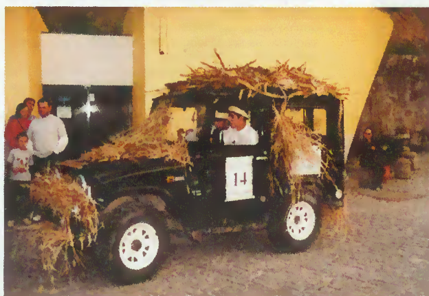
Um dos carros participantes