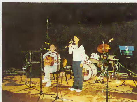
G. D. R. Juventude de Valdozende - Vencedor Escalão Infantil