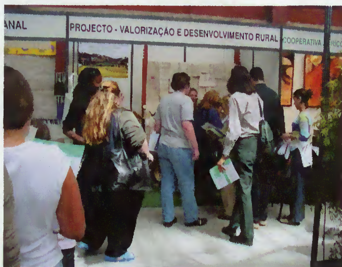
Mercado Ferreira Borges

população. A Feira que decorreu, no Mercado Ferreira Borges, no Porto, incidiu sobre temáticas como a economia local, com particular destaque para as actividades relacionadas com o turismo e a agricultura. A participação neste evento, com o intuito de informar e sensibilizar o produtor e consumidor para a qualidade dos produtos agrícolas, pretendeu, igualmente, divulgar as potencialidades do Concelho nos domínios do turismo, do património natural e paisagístico, bem como do artesanato, dos produtos agro-alimentares e da gastronomia regional.