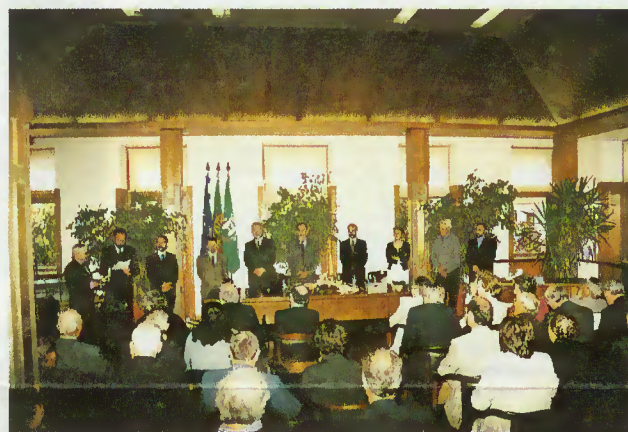
Homenagem aos autarcas