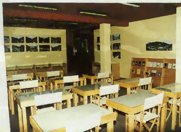
Biblioteca-Museu do Gerês