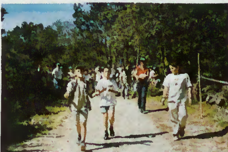
Jogo do Ovo

Esta actividade foi enriquecida com o III Festival de Concertinas organizado pela A.C.D.R. de Souto que trouxe ao local dezenas de tocadores que a todos encantaram.