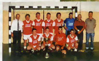
G. D. R. C. Juventude de Valdozende - equipa vencedora