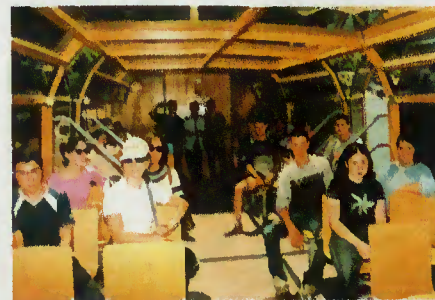
Passeio no barco «Rio Caldo»

onde os alunos puderam apreciar a beleza das paisagens naturais.