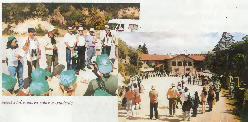
Sessão informativa sobre o ambiente

O convívio entre as crianças portuguesas e espanholas incluiu uma troca de pins , bonés e prendas, bem como um agradável percurso pedestre de quatro quilómetros pela Geira Romana. Promovida pela Câmara Municipal e com a colaboração do PNPG e do Parque Natural Baixo Límia-Serra do Xurês, esta iniciativa terminou com um almoço entre os alunos, professores e organizadores.