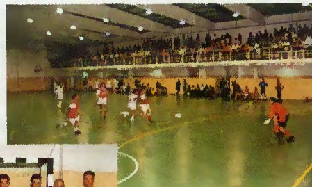
Final do torneio

Foi desta forma que chegou ao fim mais um evento desportivo organizado pela Câmara Municipal, o qual contou com a participação activa de 16 associações do Concelho, motivando a juventude terrabourense para a prática saudável do futebol. Parabéns a todos os jogadores, dirigentes e equipas de arbitragem.