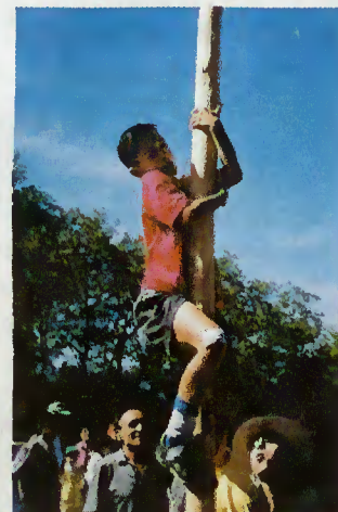
Subida ao Pau Ensebado

correio do leitor (reclamações/sugestões)