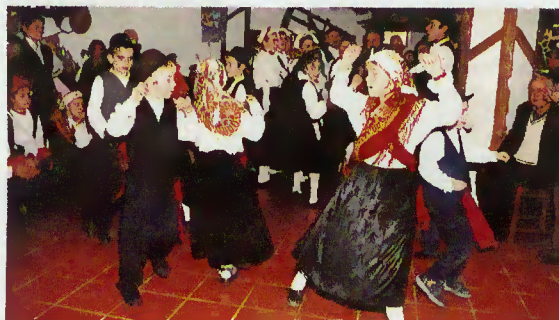
Actuação do Rancho Folclórico Infantil de Carvalheira

A Festa, tão concorrida quanto animada, terminou pelas 18.30 horas.