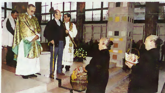
Uma imagem do ofertório

Doze autocarros percorreram as dezassete freguesias do concelho, transportando as pessoas para São Bento da Porta Aberta, em cuja