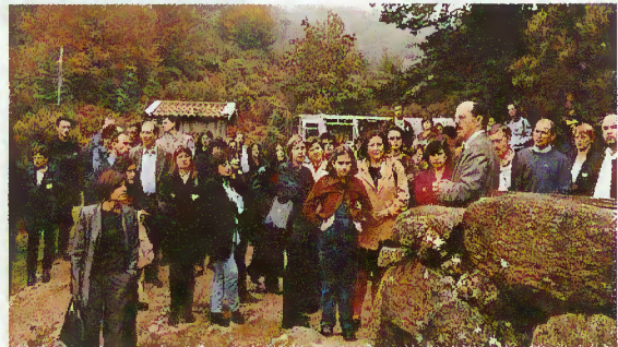
Paragem na Portela de Leonte

A Câmara Municipal promoveu, no passado dia 13 de Outubro, uma recepção aos professores e educadores que trabalham no concelho. Esta iniciativa contou com o apoio da Presidente da Direcção Executiva do Agrupamento de Escolas do vale do rio Homem, do Presidente da Comissão Executiva da escola EB 2,3 e Sec. de Rio Caldo e do Delegado Escolar de Terras de Bouro.