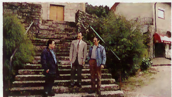
Vereador e membros da Junta de Freguesia da Ribeira

Além do Plano de Actividades para o próximo ano, nesta reunião também foram abordadas as novas competências das instituições autárquicas e a necessidade de um curso de formação para os elementos das Juntas de Freguesia na área da Informática.