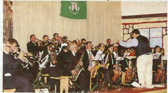
Banda Musical de Carvalheira

Num meio rico de tradições, que sempre viveu e conviveu com a música, encontrando nela o alento no trabalho e o divertimento nas festas e romarias, impunha-se assinalar este dia com alguma dignidade. Foi o que aconteceu.