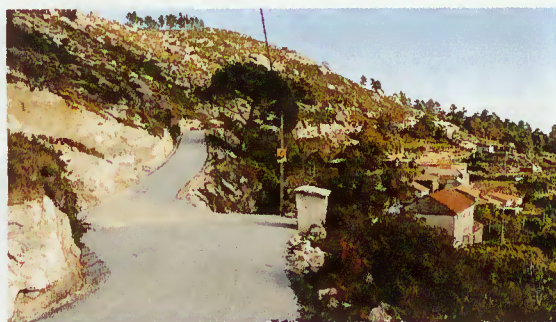
Ventozelo na freguesia de Santa Isabel do Monte

Com este melhoramento, não é só a população de Ventozelo que vê concretizado um desejo antigo, mas também fica à disposição de todos os terrabourenses e forasteiros um percurso com uma beleza paisagística muito interessante sobre o vale do Cávado.