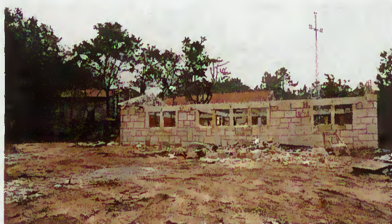
Edifício de ampliação do Museu Etnográfico

Livro aberto sobre o passado de uma aldeia rica em tradições e história, o Museu Etnográfico de Vilarinho das Furnas continua a ser um dos pontos turísticos mais importantes do concelho.