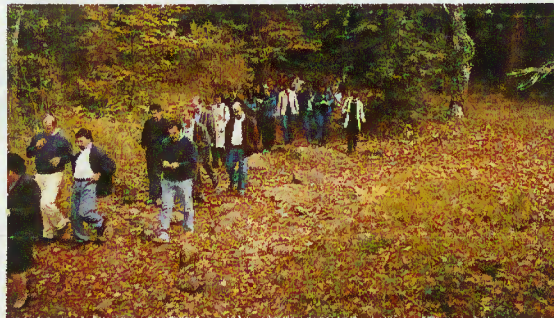
Passeio pela via romana (Geira)

O programa, que contou com a presença de cerca de 120 participantes, iniciou-se às 10.00 horas, em São Bento da Porta Aberta, com uma visita à Cripta daquele santuário. Seguiu-se uma cerimónia de acolhimento, presidida pelo senhor Presidente da Câmara Municipal, no Centro de Animação Termal da vila do Gerês, onde foi projectado um vídeo sobre o concelho.