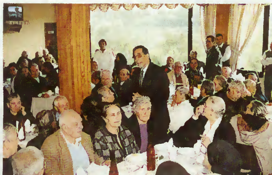
Presidente da Câmara dirige breves palavras aos Idosos

Grupo de Música Popular «Trevo Alegre» de Valdozende e Banda Musical de Carvalheira.