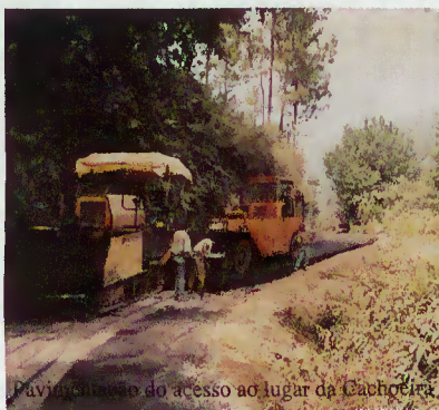
Pavimentado do acesso ao lugar da Cachoeira.

O acesso à Cachoeira, em Rio Caldo, local procurado pelos pescadores e por todos aqueles que se dirigem à margem norte da albufeira da Caniçada, na freguesia de Rio Caldo, foi pavimentado, constituindo uma melhoria significativa não só para os moradores do lugar de Parada, mas também a quantos, a partir de agora, se queiram deslocar ao outro lado da barragem.