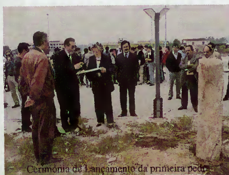
Cerimónia de lançamento da primeira pedra

A construção do novo edifício, localizado na Praça das Comunidades Geminadas, em Vila Verde, decorre em bom ritmo, tendo sido adjudicada à firma Arlindo Correia & Filhos, pelo montante de 231.040.000$. O edifício, dotado de 15 salas de aula e 5 laboratórios, terá uma capacidade para trezentos alunos, e deverá ser concluído até ao final do ano.