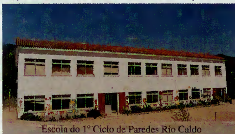
Escola do 1º Ciclo de Paredes Rio Caldo

Por esse motivo, todos os anos, durante as férias grandes, e após um levantamento exaustivo da situação material em que se encontram os edifícios escolares, são realizadas obras de conservação e de restauro.