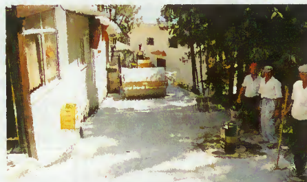
Pavimentação do lugar do Assento, Valdozende

Entretanto, foi já adjudicada, à firma Domingos Pedrosa Barreto, a pavimentação do acesso ao lugar do Bairro a qual terá de estar concluída no prazo de trinta dias.