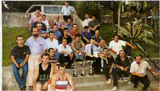
Participantes no II Torneio de Futebol Inter-Repartições