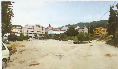
Actual Campo da Feira

O executivo municipal adjudicou, na reunião de 7 de Junho, as obras do arranjo urbanístico do Campo da Feira. Esta obra, adjudicada à firma Domingos da Silva Teixeira SA, pelo montante de 89.665.527, terá de estar