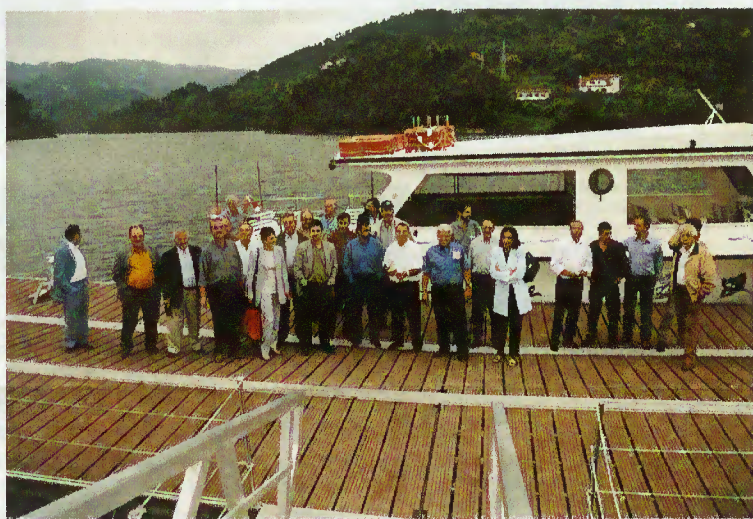
Os membros da Assembleia Municipal junto ao barco da Brancelhe

Após o almoço servido na referida estalagem, e na sequência de um convite formulado pela empresa municipal de Vieira do Minho, Brancelhe , os deputados municipais foram brindados com um passeio de barco pelas águas da barragem da Caniçada.