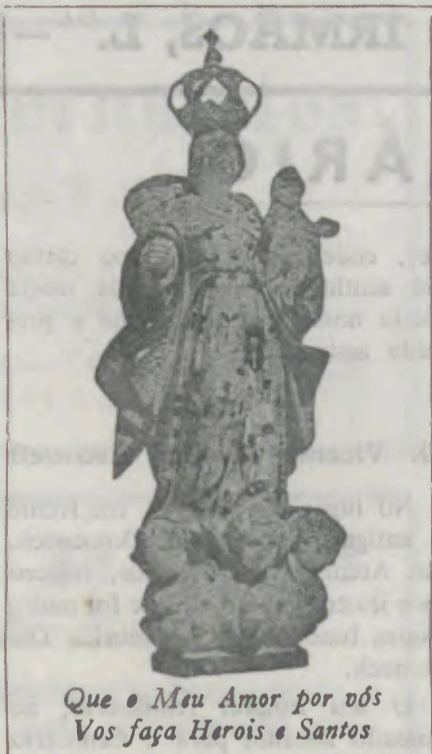
Que o Meu Amor por vós Vos faça Heróis e Santos

Oração, sacrifício e penitência. Será bom lembrar que o Mundo encontra-se em guerra permanente e, neste caminhar, surgirá a fome e a destruição será a reali-