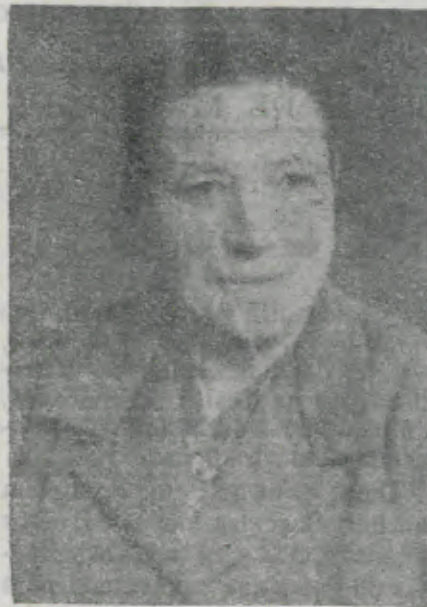
nossas felicitações com votos de uma sã e longa vida na companhia de seus familiares.