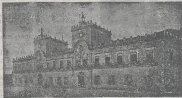
Paços do Concelho da cidade de Barcelos

No campo religioso daqui saíram figuras que pontificaram. Estou a lembrar-me de nomes como D.