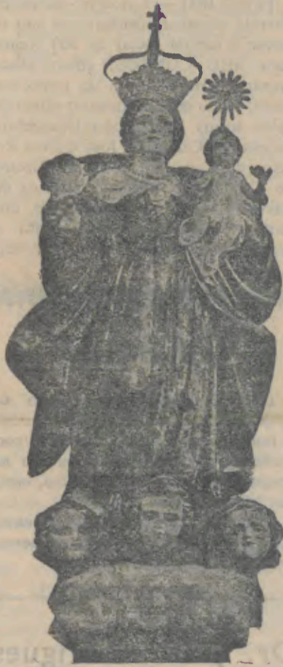
Nossa Senhora da Franqueira Salvai a Juventude e Salvai Portugal

brar-nos a Mensagem de Fátima: «Reza e fazei penitência e, por fim, o Meu Coração Imaculado Triunfará».