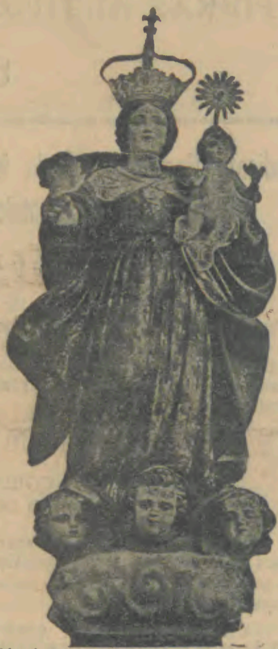
Maria estará conosco, como assim esteve no Calvario, com o Seu Amado Filho

ÚLTIMO DOMINGO DE MAIO e aos pés do Megestoso Altar, da Oração nos serviremos a favor da Paz, da Juventude, dos