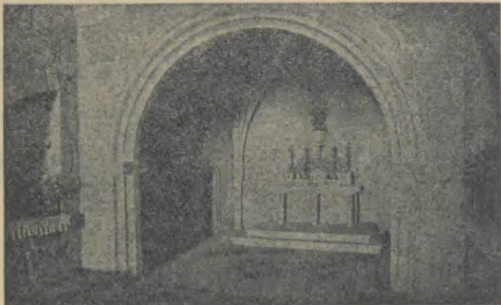
APROXIMAI-VOS DESTA ALTAR

dade Cristã, tantas vezes ameaçada. Vias-Sacras da Franqueira, encontros dolorosos à dizer nos que Cristo caminha connosco e que a Cruz é sinal de vida e salvação. Consultamos a História da verdade e ela nos relata que atravez dos tempos e nos momentos mais graves da nossa existência, como este que vivemos, algo de mistério envolve sempre a Pátria, como que um milagre surgisse ou venha a surgir. Nos nossos dias, quando tudo nos ameaçava e o direito à vida era negado, surgiu a viragem ao bom senso, a travar os vorazes conceitos, incompatíveis com a nossa Fé e com a nossa civilização religiosa, humana e social. As Vias-Sacras da Franqueira, muito nos vão dizer de Cruzeiro em Cruzeiro. Elas não falarão ape-