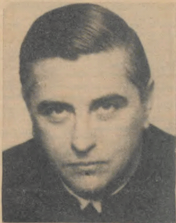
DR. GONÇALVES RAPAZOTE (Ministro do Interior)

de Barcelinhos formaram e desfilarão, frente à tribuna, com incedível garbo. O mesmo sucedeu com os Voluntários de