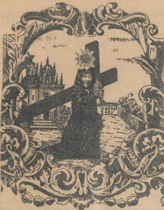
Imagem do Senhor Bom Jesus da Cruz Padroeiro dos barcelenses

Assim, de hoje até 9 de Maio, esta encantadora e hospitaleira cidade de Barcelos estará em festa.