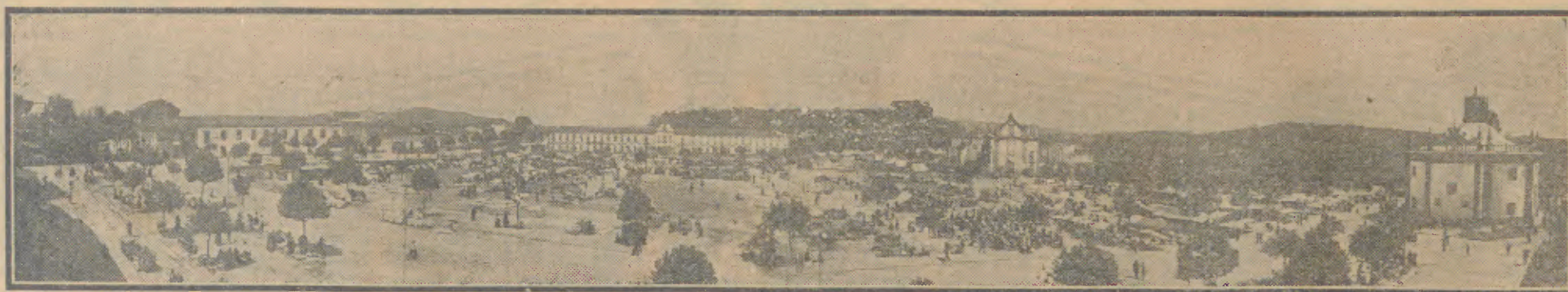
BARCELOS — A Terra mais bonita à beira mar plantada, está em Festa de 1 a 9 de Maio de 1971