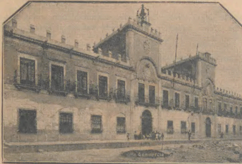
Paços do Concelho, onde, amanhã, serão recebidas as Digníssimas Autoridades Espanholas

As tradicionais Festas das Cruzes de Barcelos — A MAIOR ROMARIA MINHOTA —, este ano levadas a efeito pela Comissão Municipal de Turismo e Grémio do Comércio, em íntima e estreita colaboração com a Câmara Municipal de Barcelos, foram pelo Secretariado do Turismo e Cultura Popular, incluídas nas «FESTAS DA PRIMAVERA», destinadas a mostrar e propagandar toda a região do Minho a os turistas estrangeiros desejosos de conhecerem esta parte do território nacional.