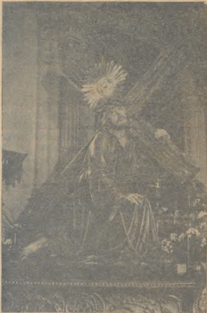
No dia 4 de Abril, magestosa Procissão dos Passos