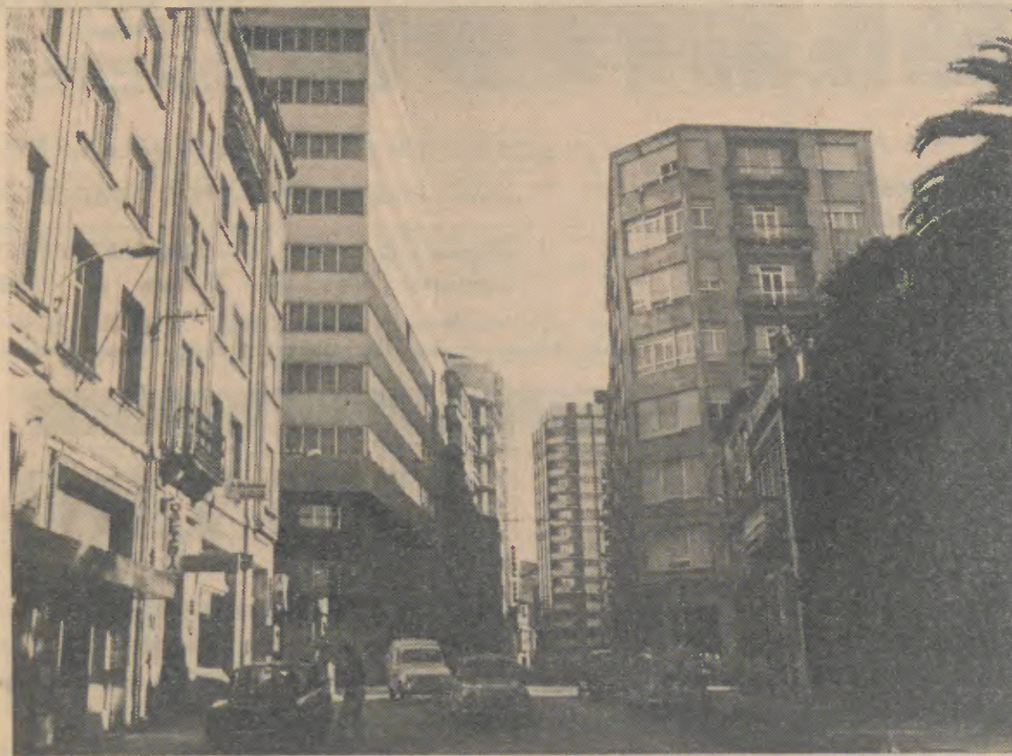
Aspecto da Cidade de Pontevedra onde se realizam as Festas em honra da Virgem Peregrina, em 14, 15 e 16 de Agosto de 1970.