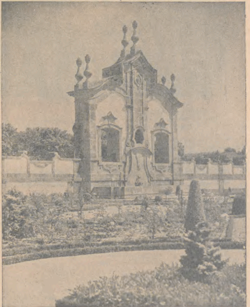
BARCELOS — Jardim das Barrocas, um dos mais admirados pelos Turistas

N. B. ■ O acesso a Barcelos e estacionamento dentro da cidade, serão devidamente organizados por brigadas da Polícia de V. T. e Polícia de S. P. A Fronteira de Valença, está aberta, com facilidades, durante os dias de Festa.