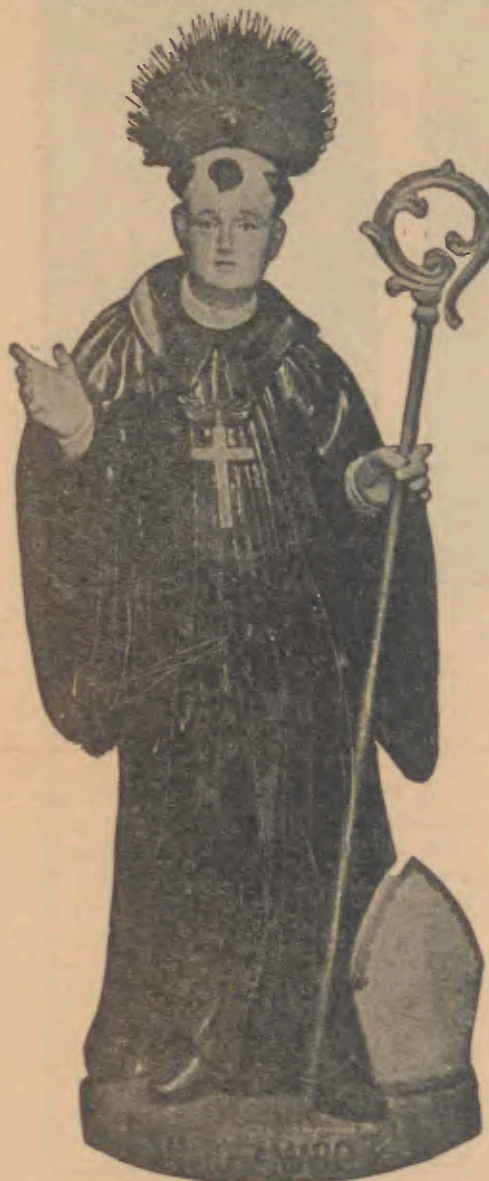
Imagem do Milagroso Santo Amaro cuja festa litúrgica, ocorrida no passado dia 15, será amanhã solenemente comemorada em Abade do Neiva, Galegos Santa Maria, Chorente, etc.

A toda a Ex.ª Família, os nossos pêsames.