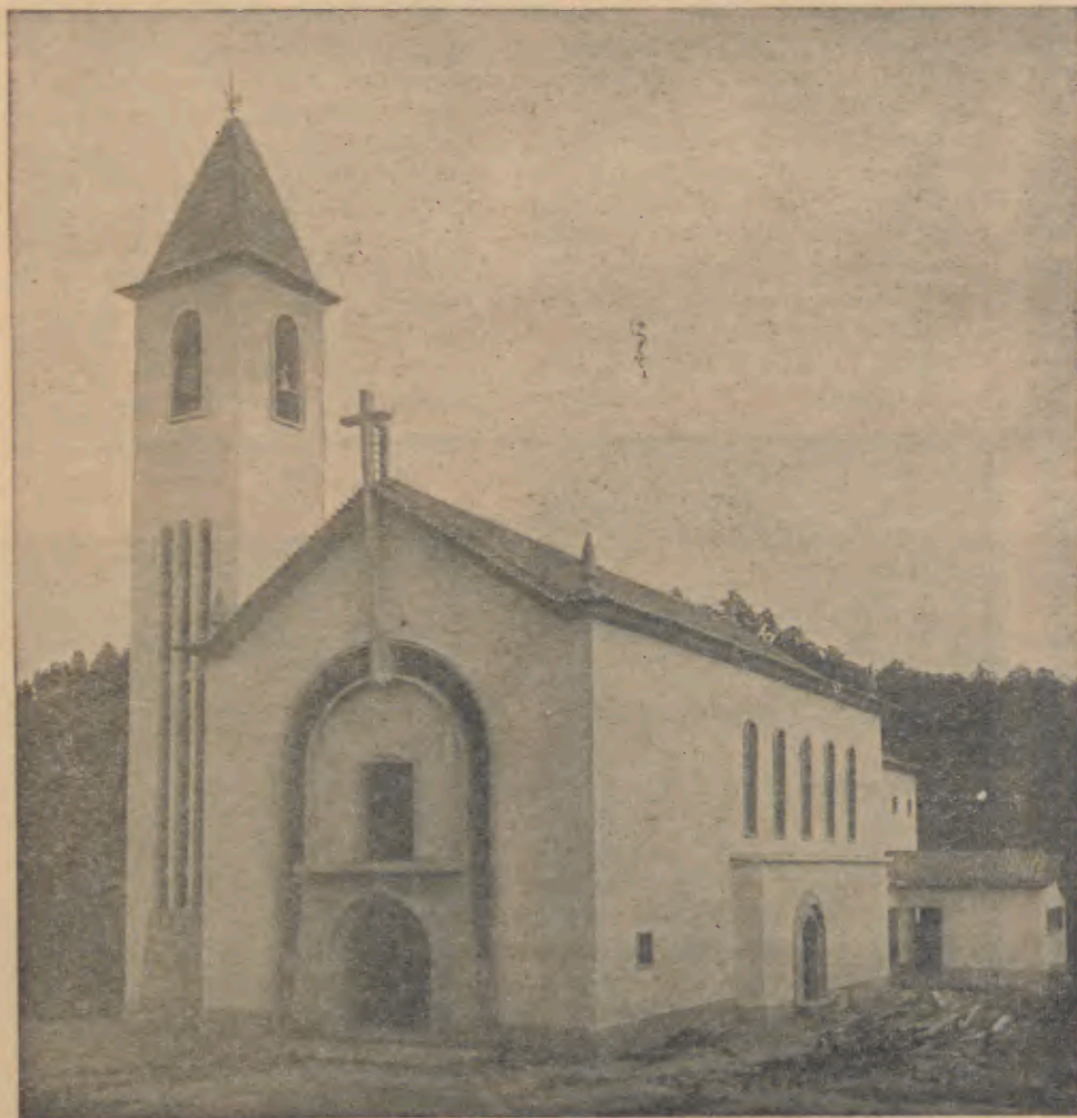
Nova Igreja Paroquial de Chorente de cuja inauguração ocorre, no próximo dia 19, o 1.º aniversário.