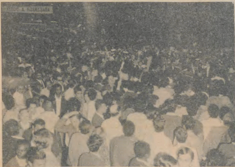
Chegada do Prof. Doutor Marcello Caetano ao Rio de Janeiro