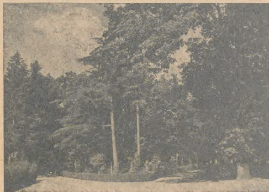
Panorâmica do Parque da Cidade de Barcelos, onde estiveram reunidos mais de 4000 Jocistas