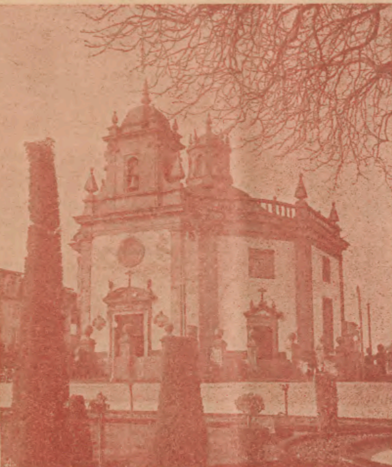
BARCELOS—Igreja do Senhor Bom Jesus da Cruz onde, no dia 3 de Maio, se vão celebrar as Festas Religiosas em honra do Padroeiro do Concelho de Barcelos