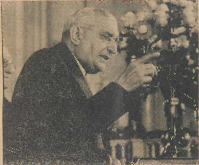
Professor Doutor Antonio de Oliveira Salazar

—grande numero de países, quer nas suas declarações, quer abstendo-se ou votando contra, quiseram manter-se fiéis á letra e ao espírito da Carta que não per-