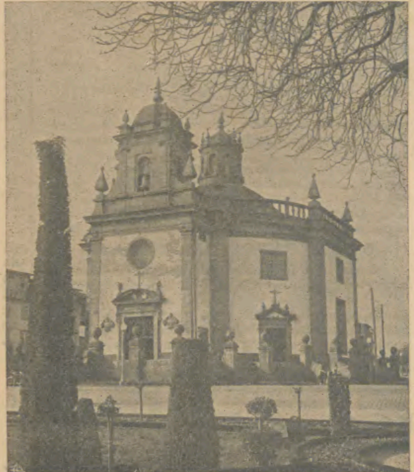
Igreja do Senhor da Cruz onde, no dia 3, se realizam grandes Solenidades

Sabemos que as obras para erguer as primeiras moradias vão ter início imediatamente.