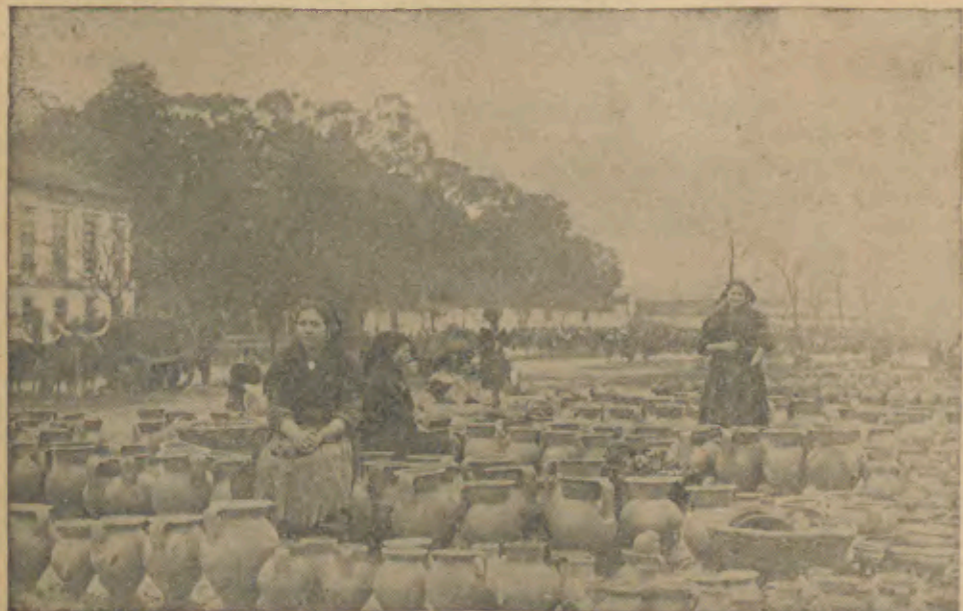
BARCELOS—Interessante aspecto da Feira da Louça