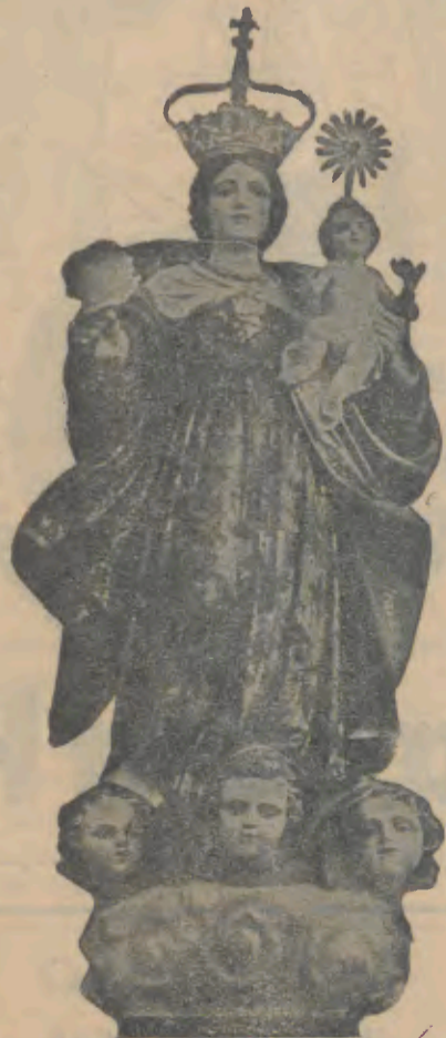
Nossa Senhora da Franqueira, rasgai as trevas para que a Paz triunfe na Terra

Na próxima segunda-feira abrem ao público as Termas do Eirogo, importante centro nacional de cura e de repouso.