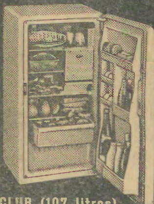
CLUB (107 litros)

Técnicamente perfeitos, económicos, práticos e elegantes!