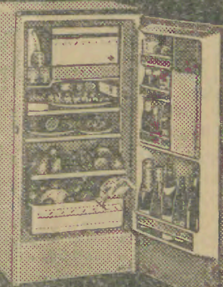
LEADER 7 (202 litros)

A sua exatidão técnica bem como o seu invulgar aproveitamento de espaço colocam-na na vanguarda dos frigoríficos de igual capacidade.