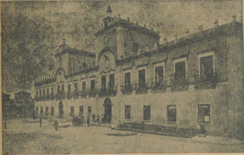
BARCELOS—O Magestoso Edifício dos Paços do Concelho, onde vai ser recebido o Ex.º Presidente da República