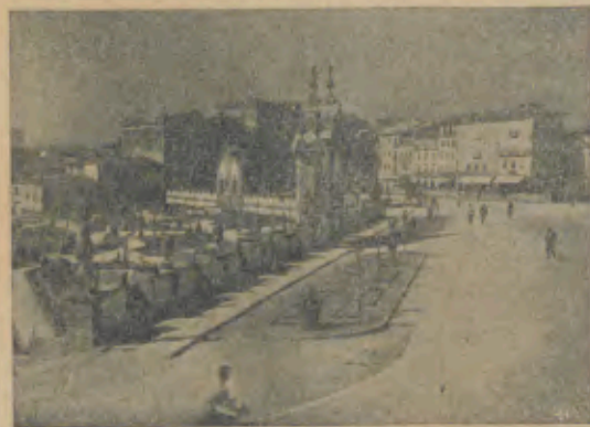
Barcelos—Parte do Passeio das Obras