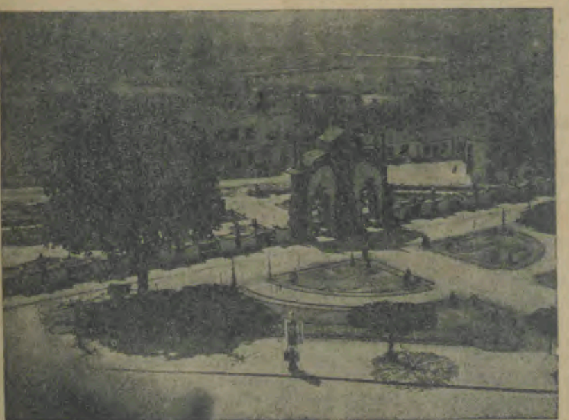
BARCELOS—O formoso Jardim das Obras

Santo Padre—anda pelo Mundo disfarçada e parece agora empenhar-se, especialmente, em roubar as crianças a Jesus Cristo. Quando as crianças brincam ou simplesmente andam na rua, quando lêem certos jornais e certos livros, quando assistem a certos espectáculos e estes já penetram nas próprias casas, a serpente do Mal pode estar escondida e ferir-lhes as almas.