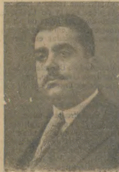
Presidente da C. M. de Turismo

lizando cada um dos 5 Continentes; verde para a Africa, vermelho para a América, branco para a Europa, azul para a Oceania e amarelo para a Asia.