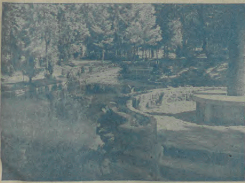
Barcelos—Um lindo aspecto do Parque da Cidade, onde, ontem, se realizou o imponente Festival Desportivo