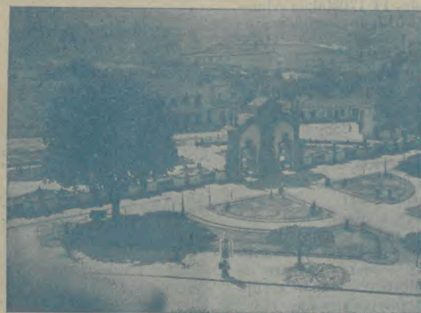
Barcelos—O Jardim das Obras que, hoje, é caprichosamente iluminado a electricidade