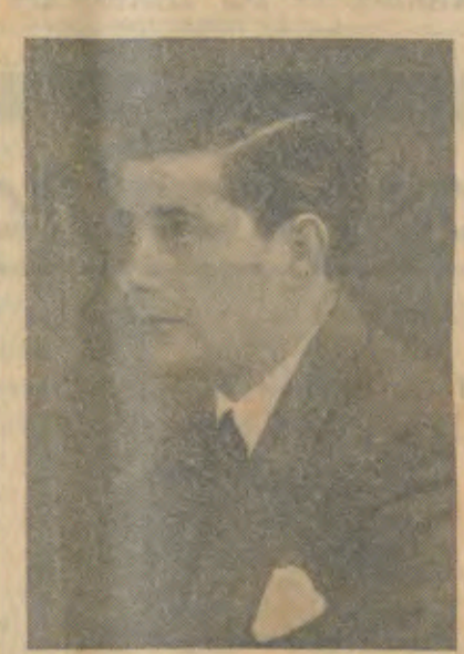
Que as almas dos dois amigos descansem em paz.